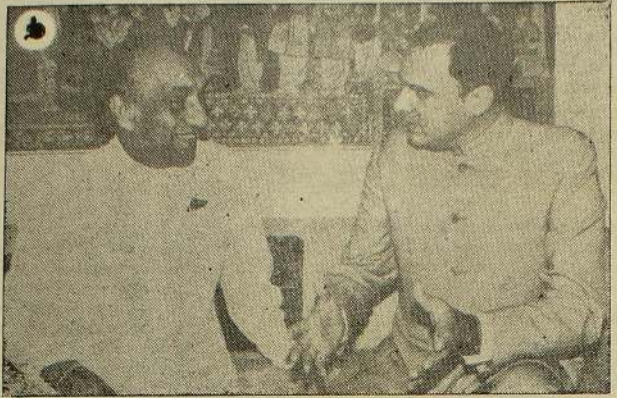
ஜே. ஆர். - ராஜீவ் சந்திப்பு