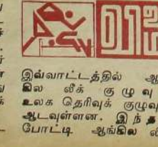
இவ்வாட்டத்தில் ஆண்டில் குழுவுள் உலக தெரிவுக் குழுவும் ஆடவுள்ளனர். இந்தப் போட்டி ஆங்கில வீக்கென் தனியடிசைக்குக் கொடுக்கப்பட்டது. இவ்வாட்டில் மரடோவின் அருமை

யான ஆட்டத்தை அவர்கள் மண்ணிலேயே காணச் சந்தர்ப்பம் கிடைத்துள்ளது. * நீண்ட கால இடைவெளியின் பின்னர் இஸ்லாமியத் தெரிவுக் குழுவின் தமிழர் ஒருவரும் இடம்பெறாத கடைந்த பந்தாட்டக் குழுக்கு மேலாக மகாராஜா ஸ்தாபன அணிக் குழு, என். டி. சி. அணிக் குழு திறமையாக ஆடிவரும் இவர்களுக்கு இச்சந்தர்ப்பம் கிடைத்தது இவரது திறமைக்குக் கிடைத்த வெகுமதியே. இவர் இறுதியாகத் தெரிவு செய்யப்பட்டார். மரடோ என்பது இன்னும் முடிவாகவில்லை. இவரின் தெரிவு அவரது திறமைக்குக் கிடைத்த வெகுமதியே.