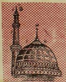
தாஹிம், எந்த மூலம் யிலாகிலும், ஒரு சலவம்

கேட்க முடிகின்றது. இவையாலும் இஸ்லாம் வழங்கிய கூட்டு முறையிலான இந்த ஹஜ்ஜை எனும் வணக்கம் சந்திக்கக்கூடியதாகும். அந்த அரபுத் பெரு வெளியிலே அறிமுகமில்லாதவர்கள்; பல மொழி பேசுபவர்கள், பல்வேறு பழக்கவழக்கமுடையவர்கள், ஒரே வித உடை உடுத்தியவர்கள், பகலில் கரும் வெயிலினும், இரவில் கரும் குளிர்வினும், ஒரே விதமாக, ஒரே சீராக, தரப்பட்ட, சொல்லிய பிரகாரம்