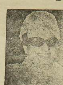
எம். ஜி. ஆர்.