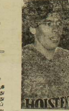
இவ்வாட்டத்தில் ஆண்டில் குழுவுள் உலக தெரிவுக் குழுவும் ஆடவுள்ளனர். இந்தப் போட்டி ஆங்கில வீக்கென் தனியடிசைக்குக் கொடுக்கப்பட்டது. இவ்வாட்டில் மரடோவின் அருமை

யான ஆட்டத்தை அவர்கள் மண்ணிலேயே காணச் சந்தர்ப்பம் கிடைத்துள்ளது. * நீண்ட கால இடைவெளியின் பின்னர் இஸ்லாமியத் தெரிவுக் குழுவின் தமிழர் ஒருவரும் இடம்பெறாத கடைந்த பந்தாட்டக் குழுக்கு மேலாக மகாராஜா ஸ்தாபன அணிக் குழு, என். டி. சி. அணிக் குழு திறமையாக ஆடிவரும் இவர்களுக்கு இச்சந்தர்ப்பம் கிடைத்தது இவரது திறமைக்குக் கிடைத்த வெகுமதியே. இவர் இறுதியாகத் தெரிவு செய்யப்பட்டார். மரடோ என்பது இன்னும் முடிவாகவில்லை. இவரின் தெரிவு அவரது திறமைக்குக் கிடைத்த வெகுமதியே.