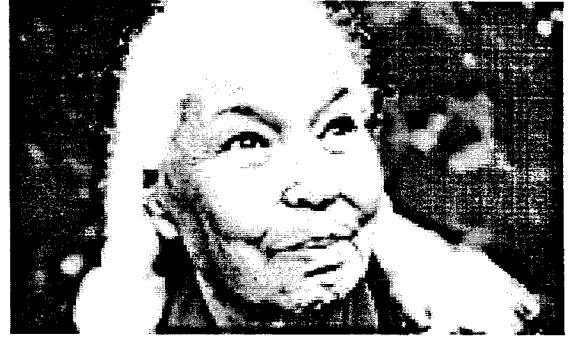
(Dr. Nawal El Saadawi)

எகிப்திய நாட்டில் தகிர் சதுக்கத்தில் நடைபெறும் ஜனநாயகத்தை நிலைநாட்ட நடைபெற்ற போராட்டத்தில் காயமுற்றோருக்கு 150 தன்னார்வ வைத்தியர்களுடன் நவால் எல் சதாவியும் நின்று சேவையாற்றுகின்றார்.