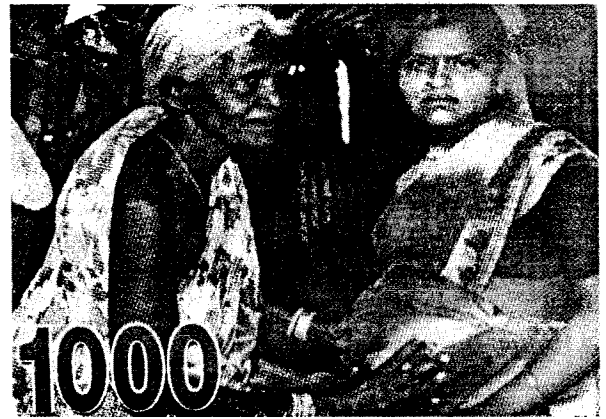
கர்ப்பிணிப் பெண்ணை பரிசோதிக்கும் பெரியதாய்

குழந்தை பெறப்போகும் பெண்ணின் உடலில் சில அறிகுறிகளை பார்த்து பிரசவிக்கப் போகும் நேரம், பிரசவம் இலகுவானதா அல்லது கடினமானதா என்பதை முற்கூட்டியே தனது அனுபவத்தின்மூலம் கண்டறிந்து கொண்டு தன்னை தயார்படுத்திக்கொள்கிறார். இதற்கு இவர் விளக்கெண்ணையை மருந்தாகவும், தனது இரு கைகளை கருவியாகவும் பயன்படுத்துகின்றார். குழந்தைப் பேறின்போது சில தாய்மாரிற்கு அதிக இரத்தப்பெருக்கு ஏற்படின் புரியாமலையை அவித்து அவற்றைக் கொண்டு ஒத்தடம் கொடுப்பது அல்லது பத்துப்போடுவதன் மூலம் இரத்தப் பெருக்கை நிறுத்துகின்றார்.