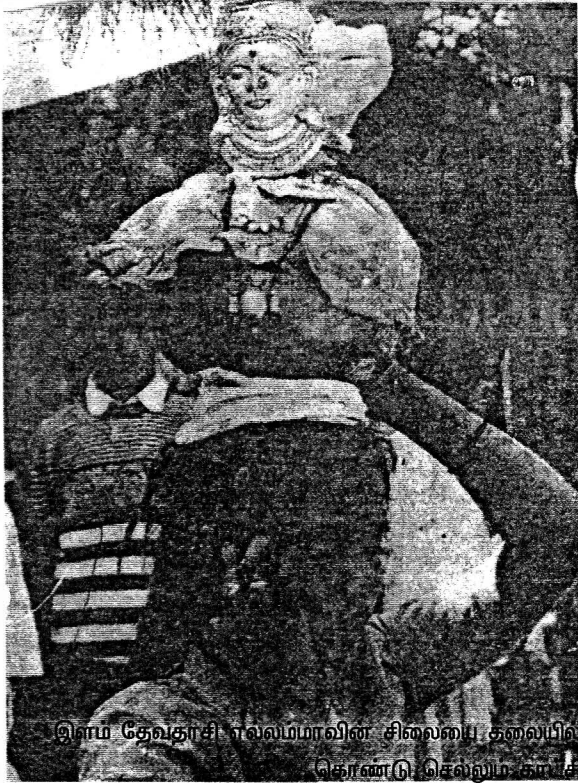
இளம் தேவதாசி எல்லம்மாவின் சிலையை தலையில் கொண்டு செல்லும் காட்சி

பூரணை அன்று இளம் தேவதாசிகள் சிவப்பு வண்ண உடையணிந்து எல்லம்மாவின் சிலையை தமது தலையில் சுமந்து குலதெய்வத்திற்கு தம்மை காணிக்கையாக்கும் சடங்குகளில் ஈடுபடுவர். இச்சடங்குகள் யாவும் நிறைவு செய்யப்பட்ட பின்னர் இவர்கள் ஏலத்திற்கு விடப்படுகின்றனர். இவைகள் யாவும் தடை செய்யப்பட்ட போதிலும் இவ்வணக்கம் தொடர்வதாக தொண்டர் நிறுவனங்கள் கூறுகின்றன