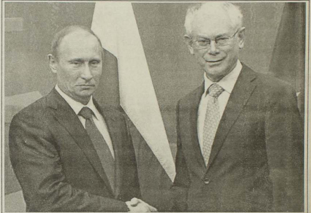
பெல்ஜியம் நாட்டின் தலைநகர் பிரெசெல்சில் உள்ள ஐரோப்பிய கூட்டமைப்பு தலைமையகத்திற்கு வருகை தந்த ரஷ்ய பிரதமர் விளாடிமிர் புட்டின்(இடது) வரவேற்கிறார் ஐரோப்பிய யூனியன் கூட்டமைப்பின் தலைவர் ஹெர்மன் வான் ரோம்பூ(வலது)