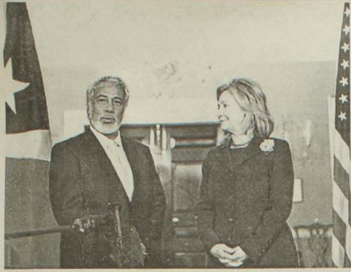
அமெரிக்காவில் சுற்றுப் பயணம் மேற்கொண்டுள்ள கிழக்கு தைமூர் பிரதமர் எக்ஸானாகுஷ்மாவோ(இடது) வாஷிங்டன் நகரில் அமெரிக்க வெளியுறவுத்துறை அமைச்சர் ஹிலாரி கிளிண்டனை சந்தித்து பேசினார்.