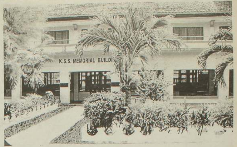
விடுதியின் நூற்றாண்டு நிகழ்வு நாளை

முன்னாள் அதிபர் ஜி. சிவ ராஜீ அவர்களின் பெருமுயற் சியினால் 30.05.1910 ஆம் ஆண்டு மீண்டும் விடுதி நிறுவப்பட்டது. அன்றிலிருந்து இன்று வரை (அசாதாரண சூழ் நிலையின் விளைவாக 1990 - 2008 ஆம் ஆண்டுகளில் விடுதி