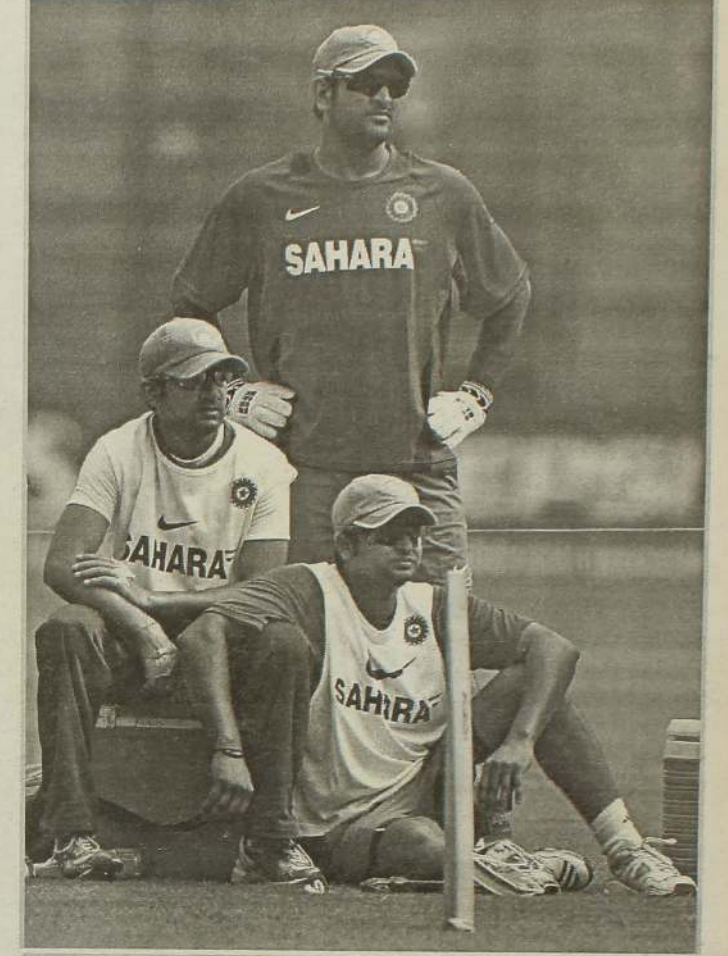
பார்வை: இந்திய - இங்கிலாந்து அணிகளுக்கிடையிலான ஆட்டத்துக்கான பயிற்சியின் இடையில் ஓய்வெடுக்கும் டோனி, ரெய்னா, கம்பீர்...

இருந்தும் அறிமுகப் போட்டியிலேயே நான்கு விக்கெட்டுகளை சரித்து தன் திறமையை நிரூபித்துவிட்டார்.