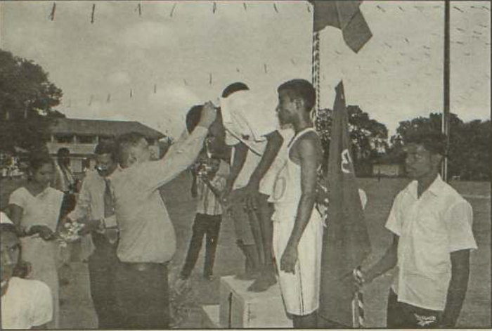
கோப்பாய் கிறிஸ்தவக் கல்லூரியின் இல்ல மெய்வன்மைப் போட்டியில் விருந்தினர்கள் அமர்ந்திருக்கின்றனர். போட்டிகளில் வெற்றியீட்டிய மாணவர் கௌரவிக்கப்படுகின்றனர்.