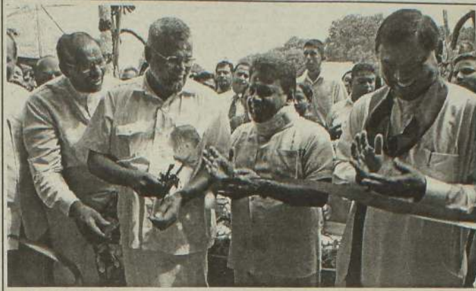
தேசிய வியாபார முகாமை நிறுவனத்தின் யாழ். பிராந்திய நிலையத்தை நேற்று அமைச்சர்களான பஸில் ராஜபக்ஷ, டலஸ் அழகப்பெரும, டக்ளஸ் தேவானந்தா மற்றும் நாடாளுமன்ற உறுப்பினர் மாவை சேனாதிராசா ஆகியோர் திறந்து வைத்த போது.

யாழ்ப்பாணம், பெப்.26 பிள்ளைகளின் எதிர்காலம் கல்வியில் தான் உள்ளது என இங்குள்ள பெற்றோர்கள் உறுதியாக நம்புகின்றனர். வடக்கின் வசந்தம் அபிவிருத்தித் திட்டத்தின் கீழ் நடைமுறைப்படுத்தப்பட்டவற்றை விட வடபகுதியில் பல்வேறு கல்வித் துறை சார்ந்த அபிவிருத்தித் திட்டங்கள் மேலும் மேலும் முன்னெடுக்கப்படவுள்ளன என இளைஞர் அலுவல்கள் மற்றும் திறன்கள் அபிவிருத்தி அமைச்சர் டலஸ் அழகப்பெரும தெரிவித்தார்.