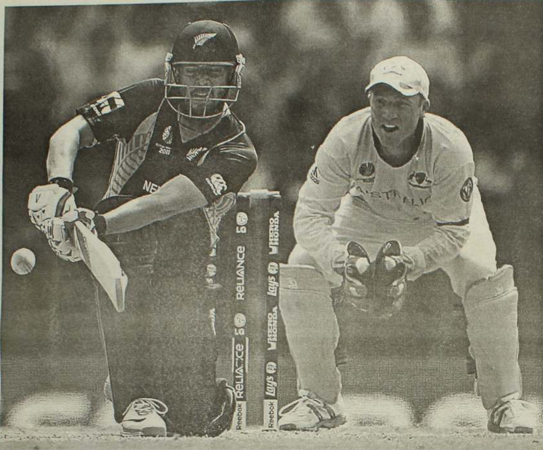
ஆட்டம்: நியூஸிலாந்து - ஆஸ்திரேலியா அணிகளுக்கிடையிலான நேற்றைய போட்டியில் நியூஸிலாந்து அணித் தலைவர் வெட்டோரியின் ஆட்டம்.