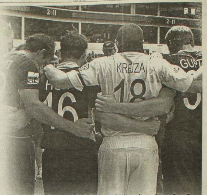
நியூஸிலாந்தில் ஏற்பட்ட புகம்பத்தில் உயிரிழந்தவர்களுக்காக நியூஸிலாந்து - ஆஸ்திரேலியா அணி வீரர்கள் அஞ்சலி செலுத்தும்போது...

-டிஸ்ட்- நாட்கூரில் நடந்தது எட்டாவது லீக் ஆட்டம். ஆஸ்திரேலியா - நியூஸிலாந்து பலப்பரிட்சை. வென்றது ஆஸ்திரேலியா. களத்தடுப்பு அவர்களது முடிவு. ஆஸ்திரேலியின் வேகம் முடித்தது நியூஸிலாந்தின் ஆட்டத்தை. குப்தில்-பிரண்டன் மக்கலம்,