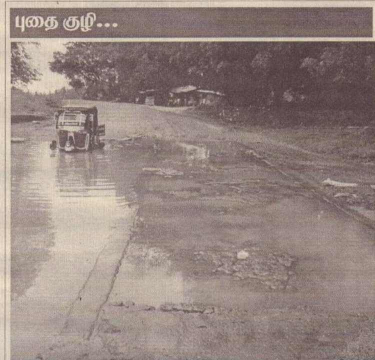
மோசமான வாய்பகுதி: கிளிநொச்சியிலிருந்து வட்டக்கச்சி, இராமநாதபுரம் பகுதிகளுக்குச் செல்லும் பிரதான வீதியிலுள்ள கிளிநொச்சிக் குளத்தின் வாய்பகுதி மோசமாகச் சேதமடைந்த நிலையில் காணப்படுகின்றது. (405)

ஆகவே தீருத்தப் பணிகளுக்கான கொடுப்பனவு எல்லோருக்கும் சமமாக வழங்க வேண்டுமென மக்கள் கேட்டுள்ளனர். (க-500)