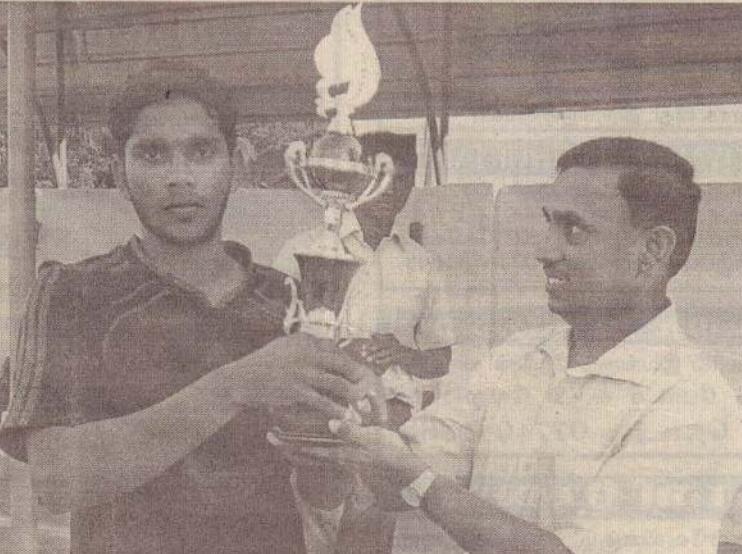
நாணயச் சுழற்சியில் வெற்றி பெற்ற திருநெல்வேலி முத்துத்தம்பி விளையாட்டுக்கழகம்

கடந்த ஞாயிற்றுக்கிழமை கோண்டாவில் இராமகிருஷ்ண மகாவித்தியாலயத்தில் இடம்பெற்ற இறுதியாட்டத்தில் திருநெல்வேலி முத்துத்தம்பி விளையாட்டுக் கழகத்தை எதிர்த்து ஊரெழு நோயல் விளையாட்டுக் கழகம் மோதியது.