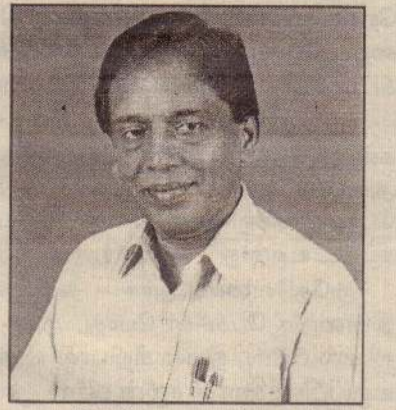
கூட இப்போது உங்களுக்குத் திருப்பித் தரவில்லை. எனவே தருபவற்றை ஒருபோதும் நிராகரிக்காதீர்கள். வாங்கிக் கொள்ளுங்கள்.

அதற்காக அவர்களுக்கு நன்றிக்கடன் செலுத்த வேண்டும் என்று நினைக்காதீர்கள். ஏனெனில் உங்களைச் சுரண்டியவர்கள் அதில் ஒரு சதவீதத்தைக்