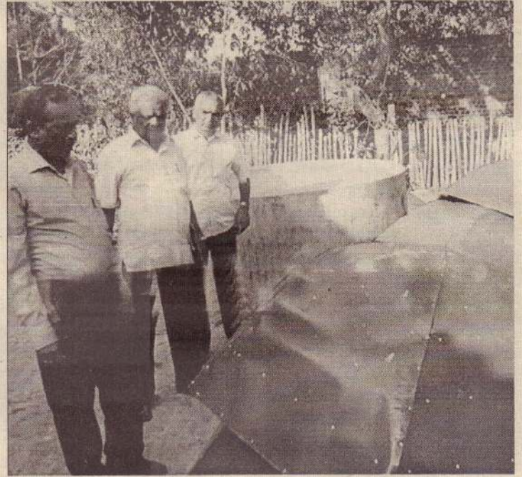
ஆரையம்பதி பிரதேச செயலாளர் பிரிவில் தும்புத் தொழிலில் ஈடுபட்டு வருபவர்களுக்கு விசேட கூடாரங்களை வழங்கும் நிகழ்வு கடந்த திங்கட்கிழமை மாலை ஆரையம்பதி வள நிலையத்தில் இடம்பெற்றது. இந்த நிகழ்வில் மட்டக்களப்பு மாவட்ட நாடாளுமன்ற உறுப்பினர் பொன்.செல்வராசா கலந்துகொண்டு தகரத் திலான கூடாரங்களை வழங்கினார். (ச)