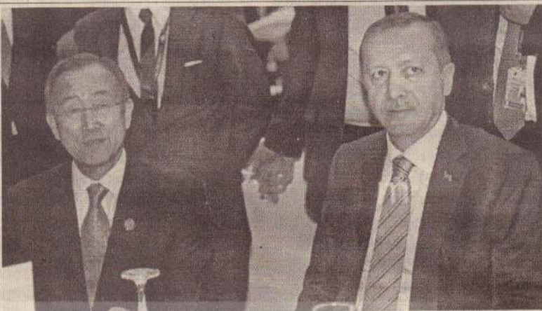
வளர்முக நாடுகளின் நான்காவது ஐ.நா. மாநாடு துருக்கி நாட்டின் இஸ்தான்புல் நகரில் நடைபெற்றது. இதில் ஐ.நா. பொதுச்செயலாளர் பான்-கீ மூன், துருக்கி நாட்டுப் பிரதமர் ரீசெப் தையாப் ஈர்டோகன் ஆகியோர் கலந்து கொண்டனர்.

தீவிரவாதிகள் ரிமோட் கண்ட்ரோல் மூலம் இயங்கும் விமானத்தைக் கொண்டு இஸ்லாமாபாத்தின் மீது தாக்குதல் நடத்தலாம் என்று பாதுகாப்பு அதிகாரிகள் சமீபத்தில் எச்சரிக்கை செய்துள்ளது குறிப்பிடத்தக்கது.