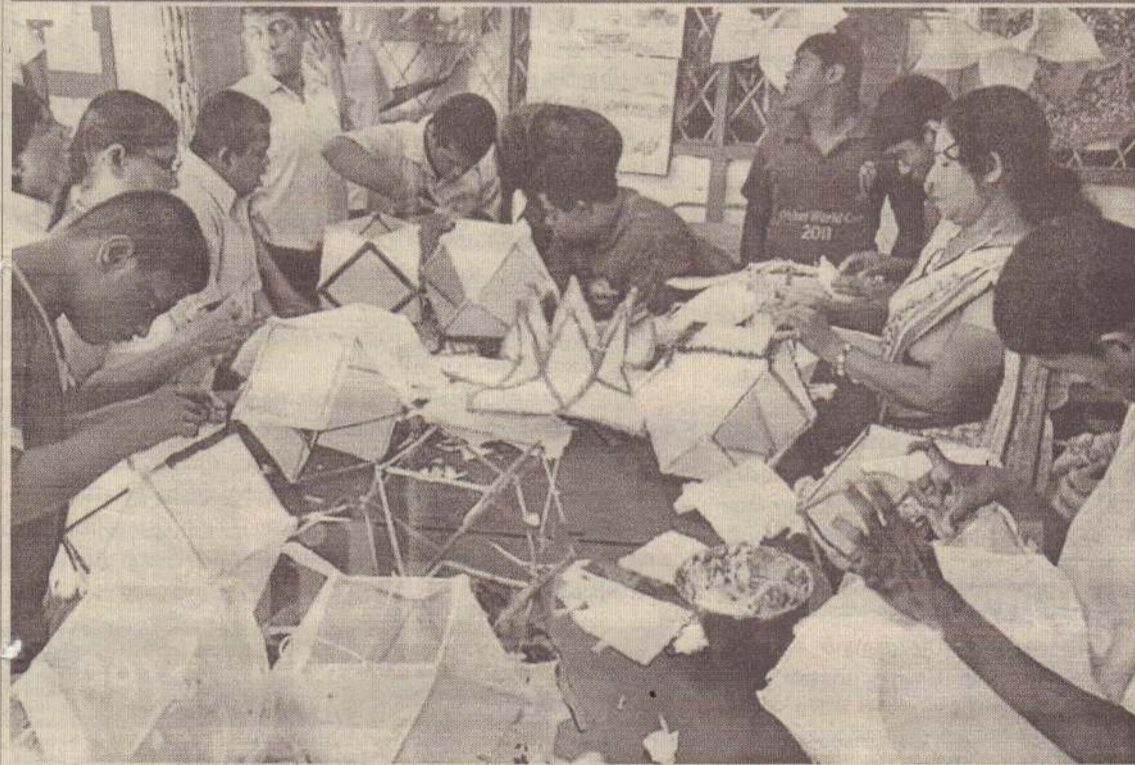
2600ஆவது புத்த ஜெயந்தியை முன்னிட்டு கல்கிஸ்ஸையிலுள்ள மன வளர்ச்சி குன்றியோருக்கான சுமகா பயிற்சி நிலையத்தில் பயிற்சி பெறுபவர்கள் வெசாக் கூடுகளை அமைப்பதில் மும்முரமாக ஈடுபட்டிருப்பதைப் படத்தில் காணலாம். (தமிழீழின்)