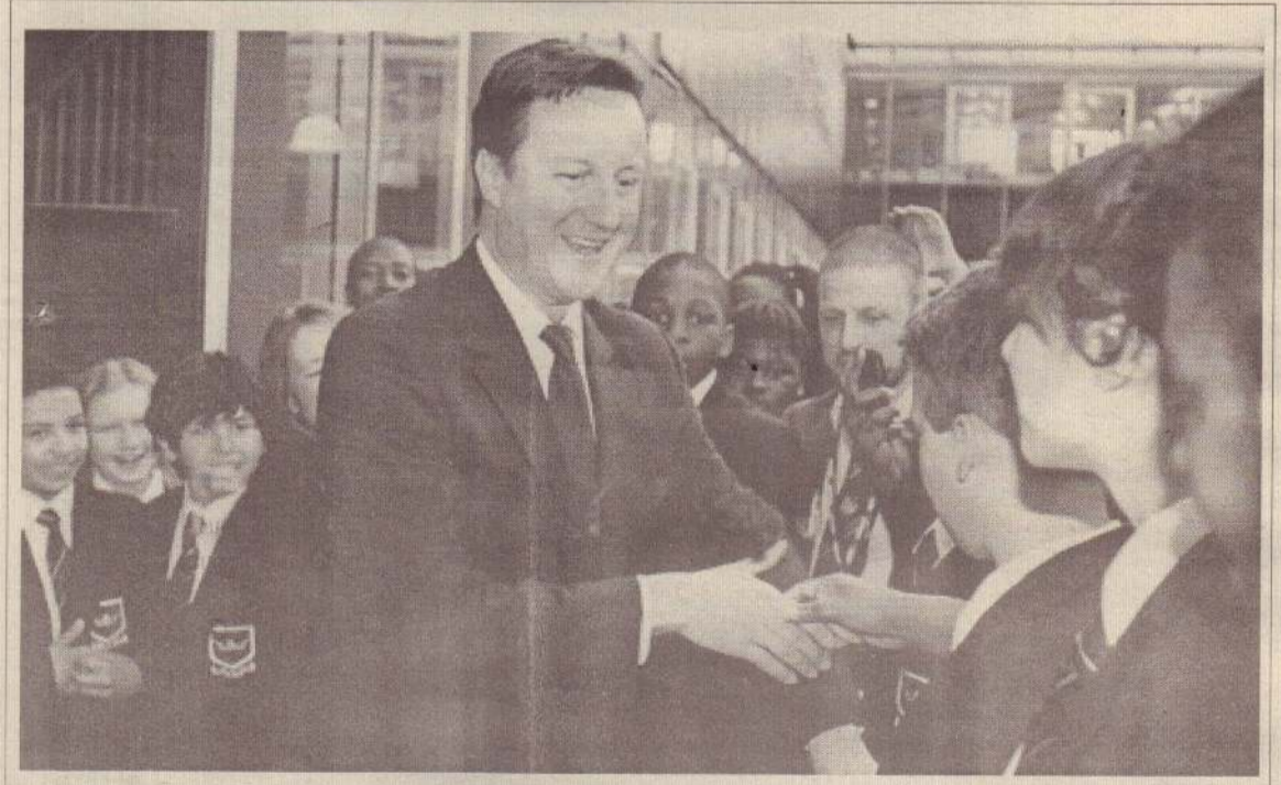
பிரிட்டனின் தென்கிழக்கு லண்டன் நகரில் உள்ள கிங்ஸ்ட்லே நகரில் உள்ள பாடசாலை ஒன்றுக்கு வந்த பிரதமர் டேவிட் கெமரூனை மாணவர்கள் வரவேற்கின்றனர்.

பாகிஸ்தான் பிரதமர் சீனா பயணம் பாகிஸ்தான் - சீனா இடையே பல்வேறு பொருளாதார மற்றும் பண்பாட்டு ஒப்பந்தங்களில் கையெழுத்திடுவதற்காக, பாகிஸ்தான் பிரதமர் கிலானி இம்மாதம் 17ஆம் திகதி முதல் 20ஆம் திகதி வரை சீன விஜயத்தை மேற்கொள்கிறார். பின்லேடன் கொலைக்குப் பின்னர் அமெரிக்கா உடனான உறவில் சிக்கல் ஏற்பட்டுள்ளதையடுத்து, உடனடியாக கிலானி சீன விஜயத்தை மேற்கொள்வது முக்கியமாகக் கருதப்படுகிறது.