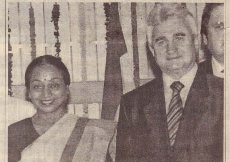
டில்லியில், செஷ் ரிப்பளிக்கின் செனட் தலைவர் மிலன், சபாநாயகர் மீரா குமாரசை செஷ் ரிப்பளிக்கின் செனட் தலைவர் மிலன், டில்லியில் சந்தித்துப் பேசிய போது...