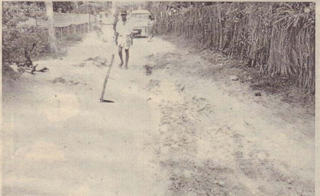
பாதிப்பு:-அண்மையில் ஏற்பட்ட வெள்ளம் காரணமாக மட்டக்களப்பு, ஜெயந்திபுரம் பாடசாலை வீதி போக்குவரத்து செய்ய முடியாத நிலையில் பாதிப்படைந்து காணப்படுகின்றது. (ச)