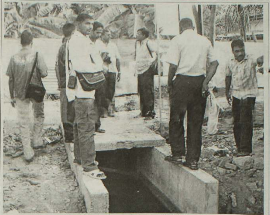
அக்கரைப்பற்று, 13ஆம் கிராம சேவகர் பிரிவில் சோவ்சா அமைப்பினால் அமைக்கப்பட்ட வடிகால் மக்களின் பாவனைக்காக நேற்றுமுன்தினம் வியாழக்கிழமை திறந்து விடப்பட்டுள்ளது. (ச)

அத்துடன் ஒரே நுழைவாயில் இருக்க முடியாது. நமது சபைக்கு என்று தனிச் சுற்று மதிலும் தனி நுழைவாயிலும் அமைக்கப்பட வேண்டும். மாநகரசபைக்குரிய வளங்களும் சொத்துகளும் பாதுகாக்கப்பட வேண்டியது மிகவும் அவசியமாகும். இதற்கு முதல்வர் உரிய நடவடிக்கை எடுக்க வேண்டும் - என்று வலியுறுத்தினார். (ச)