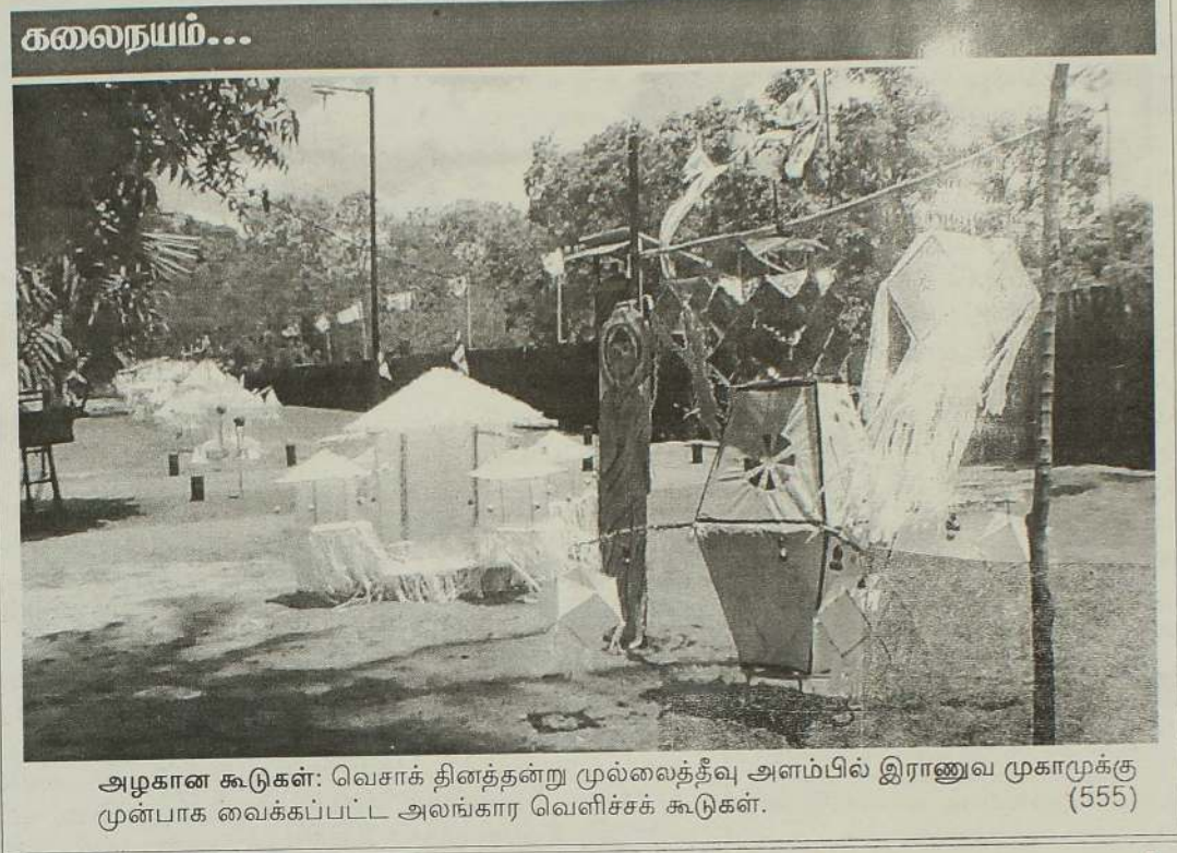
அழகான கூடுகள்: வெசாக் தினத்தன்று முல்லைத்தீவு அளம்பில் இராணுவ முகாமுக்கு முன்பாக வைக்கப்பட்ட அலங்கார வெளிச்சக் கூடுகள். (555)