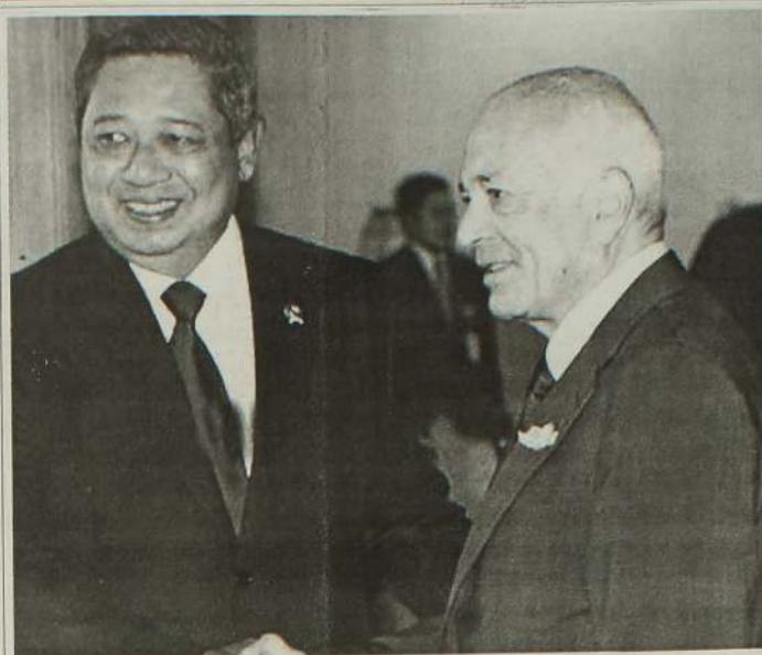
இந்தோனேசியாவின் பாலிதீவில் நடைபெற்ற நிகழ்ச்சி ஒன்றில் கலந்துகொண்ட எகிப்து நாட்டின் வெளியுறவுத்துறை அமைச்சர் நபில் அல் அராபியை (வலது) வரவேற்கிறார் அதிபர் பாம்பாங் யதோயோனோ.

கடந்த மே 2ஆம் திகதி பாகிஸ்தானின் அபோதாபாத்தில் ஓசாமா பின்லேடன் அமெரிக்கப் படையினரால் கொல்லப்பட்ட சம்பவத்தைத் தொடர்ந்து அங்கு ஆங்காங்கே பல்வேறு குண்டு வெடிப்புச் சம்பவங்கள் நிகழ்ந்து வருவது குறிப்பிடத்தக்கது.