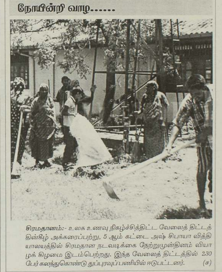
சிரமதானம்:- உலக உணவு நிகழ்ச்சிக்கு திட்ட வேலைத் திட்டத் துணிக் அக்கரைப்பற்று, 5 ஆம் கட்டை அஷ் சிபாயா வித்தியாலயத்தில் சிரமதான நடவடிக்கை நேற்றுமுன்தினம் வியாழக் கிழமை இடம்பெற்றது. இந்த வேலைத் திட்டத்தில் 230 பேர் கலந்துகொண்டு துப்புரவுப்பணியில் ஈடுபட்டனர். (ச)

அதற்கு ஏற்ற முறையில் இன்றுள்ள ஆயுர்வேத வைத்திய அமைப்புக்களும் செயல்பட வேண்டும்- என்றார். (ச)