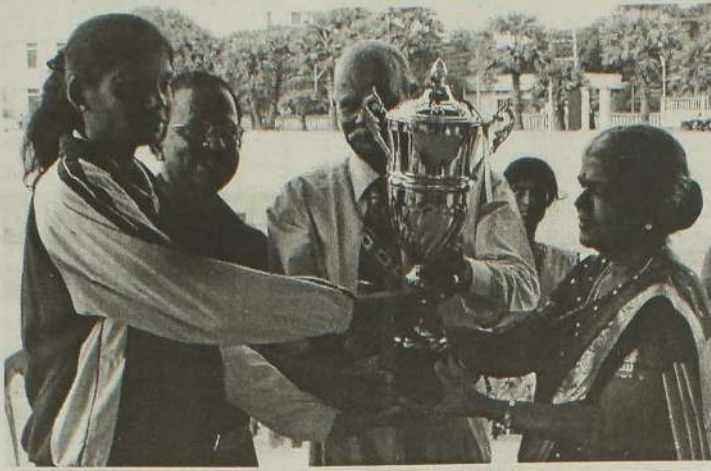
பெற்று தீவகக் கல்வி வலயம் கொண்டன. (த-23) ஐந்தாமிடத்தையும் பெற்றுக்

இந்தப் போட்டியில் 449 புள்ளிகளைப் பெற்று யாழ். கல்வி வலயம் இரண்டாம் இடத்தையும், 194 புள்ளிகளைப் பெற்று வடமராட்சி கல்வி வலயம் முன்றாமிடத்தையும், 107 புள்ளிகளைப் பெற்று தென்மராட்சி கல்வி வலயம் 4 ஆம் இடத்தையும், 50 புள்ளிகளைப்