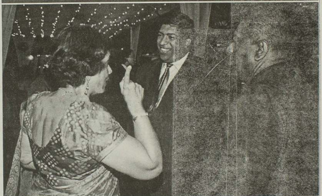
முயற்சி திருவினையாக்கும்: நோர்வே அரசியலமைப்பு தின நிகழ்வு நோர்வே தூதரகத்தினால் கொழும்பில் நேற்றுமுன்தினம் வியாழக்கிழமை நடத்தப்பட்டது. இந்த நிகழ்வில் முன்னாள் ஜனாதிபதி சந்திரிகா குமாரதுங்க, நாடாளுமன்ற உறுப்பினர்களான ரவிகருணாநாயக்க, மங்களா சமரவீர ஆகியோர் சந்தித்து கலந்துரை யாடுகின்றனர். அமைச்சர் நவீன் திலாநாயக்க, பிரதியமைச்சர் எம்.எல்.ஏ.எம். ஹிஸ்புல்லாஹ், ஐ.தே.க நாடாளுமன்ற உறுப்பினர்கள் சஜித் பிரேமதாஸ ஆகியோரும் நிகழ்வில் கலந்து கொண்டிருந்தனர். (ச)