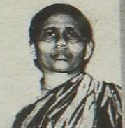
18 ஈழத்தின் முநற் பெண் கவிஞர்

வன்னேரிக்குளம், ஆனைவிழுந்தான் 10ஆம் குறுக்குத் தெருவில் அமைந்துள்ள அணைக்கு அண்மித்த பகுதிகளில் கண்ணிவெடியகற்றும் பணிகள் இடம்பெற்று வருகின்றன. இதன் போது அணையுடன் அமைந்திருந்த கைவிடப்பட்ட காவலரண் முன்பாக மேற்குறித்த மனித மண்டையோடு மீட்கப்பட்டது. சம்பவ இடத்துக்கு நேரடியாக விஜயம் (29ஆம் பக்கம் பார்க்க)