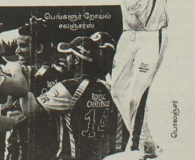
பெங்களூர் ரோயல் சலஞ்சர்ஸ்