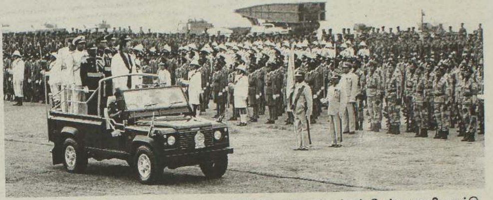
யுத்த வெற்றியின் இரண்டாம் ஆண்டு கொண்டாட்டங்கள் நேற்று காலிமுசுத்திலில் நடைபெற்றன. ஜனாதிபதி மஹிந்த ராஜபக்ஷ படையினரின் அணி வகுப்பைப் பார்வையிடுகின்றார்.

நேற்று கொழும்பு காலிமுசுத்திலில் இடம்பெற்ற யுத்த வெற்றியின் இரண்டு ஆண்டு நிறைவுவிழாவில் பிரதம அதிதியாகக் கலந்துகொண்டு நாட்டு மக்களுக்கு உரையாற்றும்போதே ஜனாதிபதி மஹிந்த ராஜபக்ஷ இதனைத் தெரிவித்தார்.