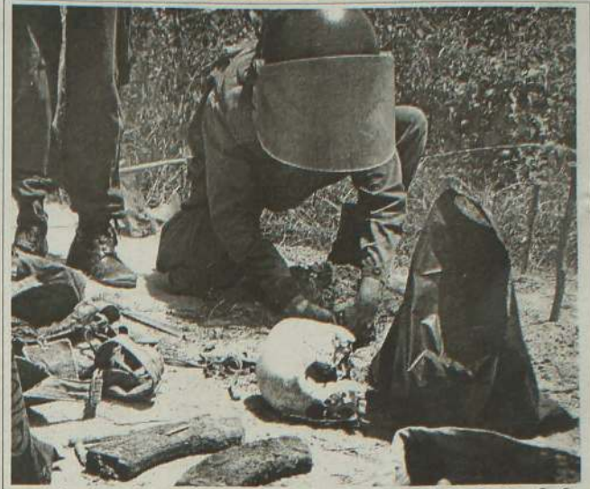
வன்னேரிக்குளம் ஆனைவிழுந்தான் பகுதியில் நேற்று கிளி நொச்சி மாவட்ட நீதிமன்ற நீதிவான் முன்னிலையில் மீட்கப்பட்ட எலும்புக்கூட்டுத் தொகுதியை படத்தில் காணலாம். (15-6)