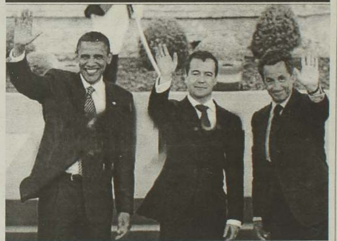
வளர்ந்த நாடுகளின் உச்சிமாநாடான ஜி-8 பிரான்ஸ் நாட்டில் தொடங்கியது. இதில் அமெரிக்க ஜனாதிபதி பராக் ஓபாமா (இடது) ரஷ்ய அதிபர் விளாடிமிர் புட்டின் (நடுவில்) பிரான்ஸ் ஜனாதிபதி நிக்கோலஸ் சர்கோலி ஆகியோர் கலந்துகொண்டனர்.