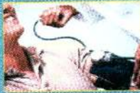
Essential Hypertension Decoded Pg 8