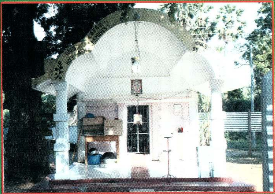
பனையிந்தேத்தில் அமரரால் உருவாக்கப்பட்ட ஆலயம்