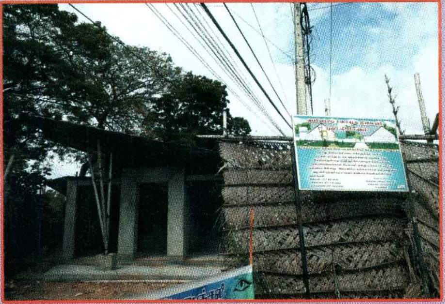
பெரிய அரசு நூலகம்