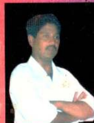
ம. தேராயிடம் (நாடகம்)