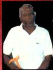
கண்டாவளை கவிர்ராயர் (மறுபுக்கலிதை)