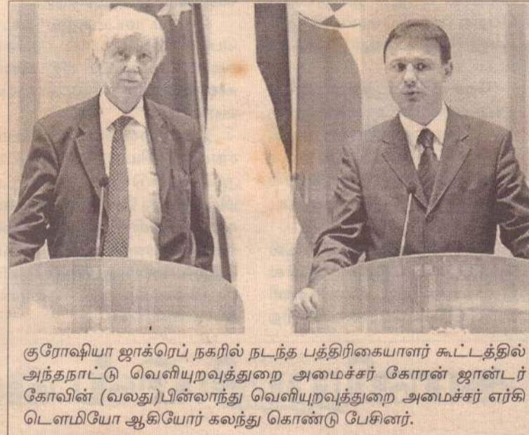
குரோஷியா ஜாக்ரெப் நகரில் நடந்த பத்திரிகையாளர் கூட்டத்தில் அந்தநாட்டு வெளியுறவுத்துறை அமைச்சர் கோரன் ஜான்டர் கோவின் (வலது) பின்லாந்து வெளியுறவுத்துறை அமைச்சர் எர்கி டொளமியோ ஆகியோர் கலந்து கொண்டு பேசினர்.

எனினும் கடாபி ஆதரவுப் படையினரிடம் கண்டுபிடிக்கப்பட்ட கனரக ஆயுதங்கள் சோவியட் ரஷ்யா காலத்தில் உற்பத்தியானவை எனக் கூறப்பட்டுள்ளது. (ந)