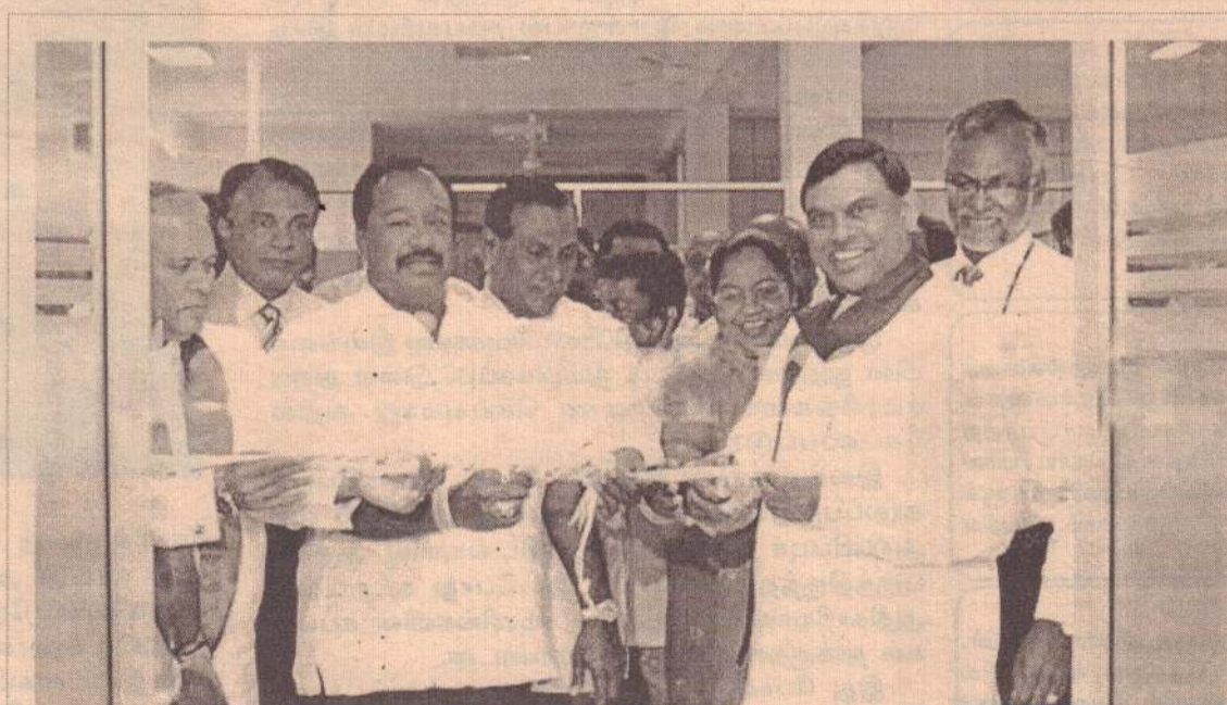
திருகோணமலை மாவட்ட செயலகத்தின் புதிய கட்டடத்தினை பொருளாதார அபிவிருத்தி அமைச்சர் பசில் ராஜபக்ஷ கடந்த செவ்வாய்க்கிழமை திறந்து வைத்துள்ளார். இந்தநிகழ்வில் மூத்த அமைச்சர் அதாவுட செனவிரத்தன, பொது நிர்வாக உள்நாட்டு அலுவல்கள் அமைச்சர் ஜோன் செனவிரத்தன உட்பட பல பிரமுகர்கள் கலந்து கொண்டனர்.