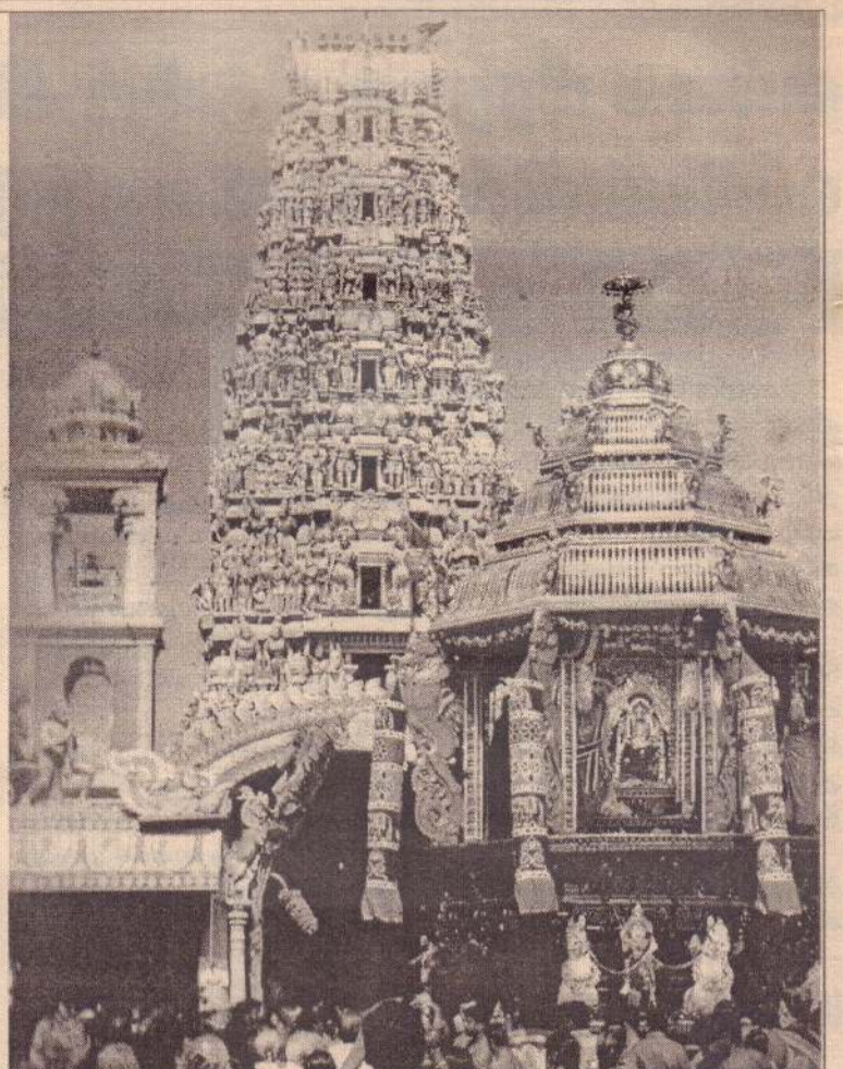
வண்ணை வெங்கடேஸ்வரர் பெருமாள் ஆலயத்தில் அண்மையில் இடம்பெற்ற தேர்த் திருவிழாவில் சுவாமி தேரில் ஆரோகணித்து விதி வலம் வருகிறார்.