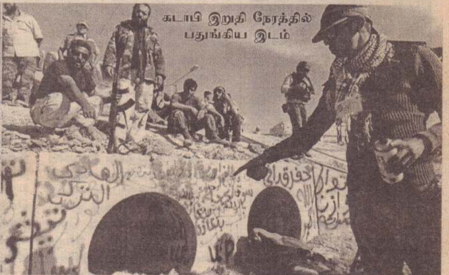
கடாபி இறுதி நேரத்தில் பதுங்கிய இடம்

திரிபோலி, ஒக்ரோபர் 21 விபிய ஜனாதிபதி மும்மர் கடாபி நேற்று கிளர்ச்சிப் படைகளின் தாக்குதலில் கொல்லப்பட்டார். அவர் பதுங்கியிருந்து பதுங்குபி மீது கிளர்ச்சிப் படைகள் தாக்குதலை நடத்தின. இதில் கடாபி கொல்லப்பட்டார். விபியாவை கடந்த பல தசாப்தங்களாக ஆட்சி செய்த சர்வாதிகாரி கேனல் மும்மர் கடாபி தாங்கள் நடத்திய தாக்குதலில் கொல்லப்பட்டுவிட்டதாக விபியாவின் இடைக்கால அரசு அதிகாரிகள் நேற்றிரவு அறிவித்துள்ளனர். கடாபியின் பிறந்த ஊரான சிர்த்தை தாங்கள் கைப்பற்றிவிட்டதாக இந்தப் படைகள் அறிவித்த சில மணி நேரத்தில் கடாபியை தாங்கள் கொன்றுவிட்டதாக அவர்கள் அறிவித்திருக்கின்றனர். கடாபியின் சடலம் முகம் மற்றும் உடலில் காயங்களுடன் இரத்தம் வழிந்த நிலையில் தொலைக்காட்சிகளில் காண்பிக்கப்பட்டது. அதனைப் பார்த்துக் கிளர்ச்சியாளர்கள் ஆர்ப்பரித்தனர்.