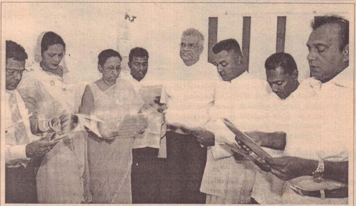
ஐக்கிய தேசிய கட்சி சார்பாக தெஹிவளை, கல்விசை மாநகர சபை உறுப்பினர்களாகத் தெரிவு செய்யப்பட்டவர்கள் எதிர்க்கட்சி தலைவர் ரணில் விக்கிரமசிங்க முன்னிலையில் நேற்றுமுன்தினம் புதன்கிழமை சத்தியப்பிரமாணம் செய்து கொண்டனர்.

- இவ்வாறு இரகசிய அஞ்சலில் தெரிவிக்கப்பட்டுள்ளது. (ச-சி)