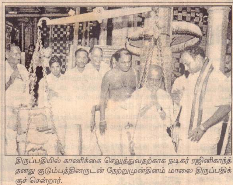
திருப்பதியில் காணிக்கை செலுத்துவதற்காக நடிகர் ரஜினிகாந்த் தனது குடும்பத்தினருடன் நேற்றுமுன்தினம் மாலை திருப்பதிக்குச் சென்றார்.

பெங்களூர், ஒக். 21 சொத்துக் குவிப்பு வழக்கு தொடர்பாக ஜெயலலிதா நேற்று பெங்களூர் தனி நீதிமன்றத்தில் ஆஜரானார். ஆஜராக வந்த தமிழக முதல்வர் ஜெயலலிதாவுக்கு எதிராக கர்நாடகத்தைச் சேர்ந்த தலித் அமைப்பு ஒன்று ஆர்ப்பாட்டம் நடத்தியது. பரமக்குடியில் பொலிஸார் நிகழ்த்திய துப்பாக்கிச் சூடு சம்பவத்துக்கு கண்டனம் தெரிவித்து ஜெயலலிதா ஆஜரான பெங்களூர் பரப்பன்ன அக்ரஹார சிறைக்கு வெளியே சமதாசனிக் தளம் என்ற தலித் அமைப்பினர் ஆர்ப்பாட்டம் நடத்தினர். தலித்துகள் மீதான தாக்குதலுக்குப் பொறுப்பேற்று முதல்வர் பதவியில் இருந்து ஜெயலலிதா ராஜினாமா செய்ய வேண்டும் என்று அவர்கள் கோஷம் எழுப்பினர். இதைத் தொடர்ந்து ஆர்ப்பாட்டம் நடத்தியவர்களை பொலிஸார் அங்கிருந்து வெளியேற்றினர். (வ)