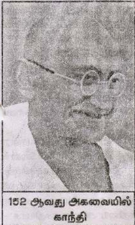
152 ஆவது அகவையில் காந்தி

காந்தியடிகளின் சிந்தனைகளும் செயற்பாடுகளும் அகிம்சை வழியில் இந்திய சுதந்திரத்தைப் போராடிப் பெறுவதும் ஒற்றுமையான அமைதியான இந்தியாவை காண்பதும், அதே சமயம் இந்திய மக்களின் வறுமையை நீக்கி வாழ்க்கைத்தரத்தை உயர்த்தி தன்னிறை பொருளாதாரத்தை அடைதலுமாக விருந்தது. இதற்காக 18 நிர்மாண திட்டங்களை வகுத்தார். அவற்றினுள் பெண்ணுரிமையும் ஒன்றாகும்.