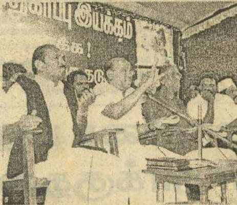
மேலும் அவர் தெரிவித்தவை வருமாறு - இலங்கைப் பிரச்சினையில் கருணாநிதி தானும் குழம்பி மற்றவர்களையும் குழப்பி வருகிறார்.

இலங்கைத் தமிழர் பாதுகாப்பு இயக்கம் சார்பில் சென்னையில் நேற்றுமுன்தினம் நடந்த கறுப்புக் கொடி ஊர்வலத்தில் பங்கேற்றுப் பேசியபோதே அவர் இதனைத் தெரிவித்தார்.