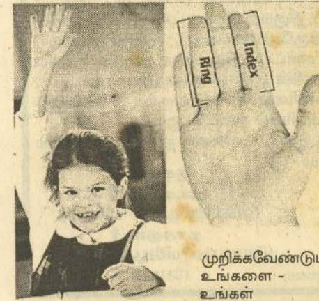
முறிக்கவேண்டும். உங்களை - உங்கள்

புன்னகைத்துக் கொண்டிருந்தார். இது ஒரு சாதாரண குழந்தையின் உணர்ச்சிவெளிப்பாடு அல்ல என்பது எனக்கு புரிகிறது. எதற்காக உணர்ச்சிகளை - அதுவும் சாதாரணமாக ஒரு செயலுக்கு - மனிதருக்கு ஏற்படும் உணர்வுகளை எனது மகன் வெளிக்காட்டுவதில்லை. பதில்: ஒவ்வொரு குழந்தைக்கும் அவர்களுக்கே உரிய குணநலனும் ஆளுமையும் (Temperament & Personality) இருக்கும். பெற்றோர் குழந்தை களுக்கு ஆதரவாக இருக்கவேண்டுமே ஒழிய அவர்களை ஓர் இலட்சிய சாதாரண குழந்தையாக மாற்றத் தெண்டிக்கக்கூடாது. உங்கள் மகனைப் புரிந்துகொள்ள அவருடன் கதைகொடுங்கள். அவர் விளையாடக் கொண்டிருக்கும் போது, அவர் தனது விருப்பங்களை, கருத்துகளைப் பேசுவார். அதற்குக் காதலிக்கொடுங்கள். நீங்கள் அவர் ஏதாவது கூறுவார் என்று தெண்டிக்கக் கூடாது. ஆனால், அவரது நல்ல நண்பர் போல் அவர் உங்களோடு பேசுவதை காதுகொடுங்கள். அநேகமான பெற்றோர் தமது குழந்தைகள் சண்டைக்காரர்கள். மற்றக் குழந்தைகளோடு சண்டை பிடிக்கின்றார்கள் என்றுதான் கவலைப்படுகின்றார்கள். உங்கள் மகன் நேரெதிராக இருக்கின்றான். இப்பொழுது எதுவும்