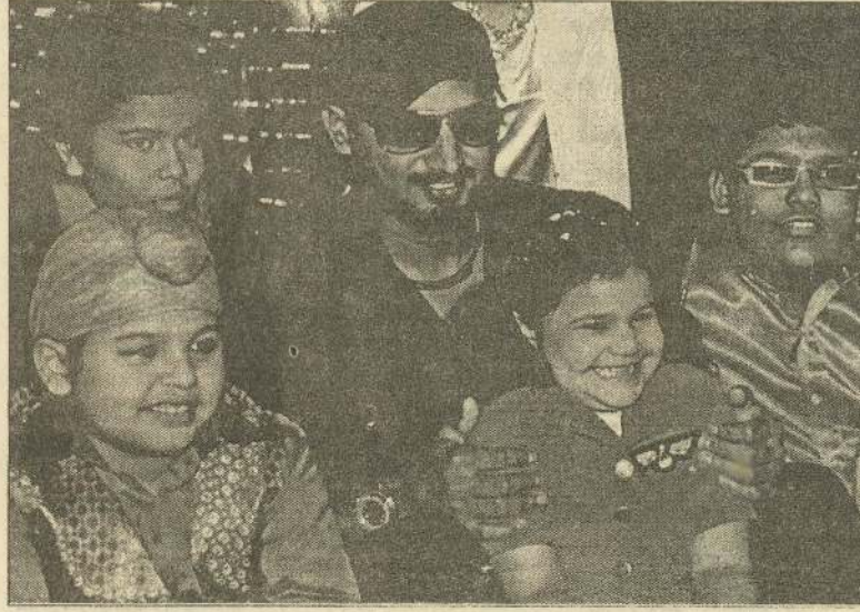
மும்பையில் நடந்த தனியார் நிகழ்ச்சியில் கலந்து கொண்ட இந்திய வீரர் ஹர்பஜன் சிறுவர்கள்ளுடன் உற்சாகமாக போஸ் கொடுத்தார்.

இவர் முதல் இன்னிங்ஸில் 3 விக்கெட்டுக்களையும் இரண்டாவது இன்னிங்ஸில் 5 விக்கெட்டுக்களையும் வீழ்த்தியமை குறிப்பிடத்தக்கதாகும்.