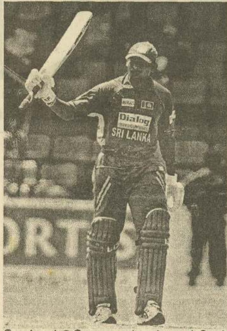
யோர் மட்டுமே அரைச்சதம் கடந்திருந்தனர். 48.5 ஓவர்கள் முடிவில் இந்திய அணி 252 ஓட்டங்களுக்கு சகல விக்கெட்

73 ஓட்டங்களுடன் அவரை வெளியேற்றினார் முரளிதரன். ஏனைய வீரர்களில் தோனி (53) ஐடேஜா (60) ஆகி