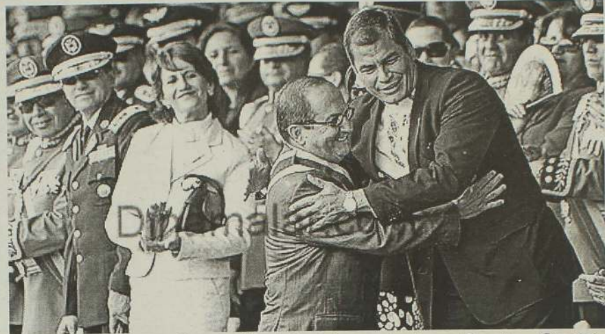
ஈக்வடோரின் ஆயுதப்படை தினம் கொண்டாடப்பட்டதையொட்டி, கிரான்ட் ரூஸ் நகரில் நடந்த விழாவில் ஜனாதிபதி ரபேல்கெரேரா (வலது) இராணுவ உயரதிகாரி ஒருவருக்குப் பாராட்டு தெரிவிக்கிறார்.

கடந்த ஏப்ரலில் நடந்த ஆபிரிக்க யூனியன் கூட்டத்தில், லிபிய விவகாரம் குறித்து மேற்கொள்ளப்பட்ட முயற்சிகள், சில மணி நேரங்களிலேயே தோல்வியில் முடிவடைந்தன. இதையடுத்து, இப்போது தென்னாபிரிக்க ஜனாதிபதி அடுத்த முயற்சியில் இறங்கியுள்ளார்.