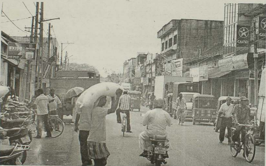
இடம் : யாழ்ப்பாணம், நேரம் : முற்பகல் 10 மணி திகதி : 26.05.2011 வீதியின் இரு மருங்கிலும் வாகனங்கள் நிறுத்தி வைக்கப்பட்டுள்ளதால் போக்குவரத்திலீடுபடும் பயணிகள் சிரமங்களை எதிர்கொள்கின்றனர்.