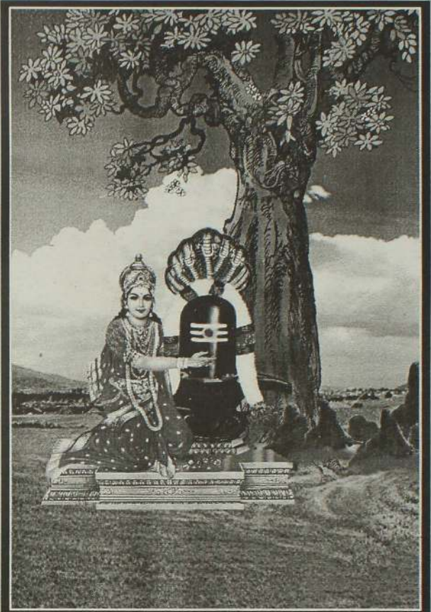
வில்வையடி மரத்தாளை வெவ்வினைகள் களைவான அல்லும் பகலுமெங்கள் தொல்லைபற அருள்வானை பெல்லா வினையகல புங்கங்குளத்தூர் புகுந்த கல்லும் கசிந்துருக பாலிகள் நாம் பணிந்தீடுவோம்.

அம்பிகையைச் சரண் புகுந்தால் அதிக வரம் பெறலாமே. நம்பியே கைதொழுவோருக்குப் பிணி நீங்கிடும். கே.வைத்திலிங்கம்