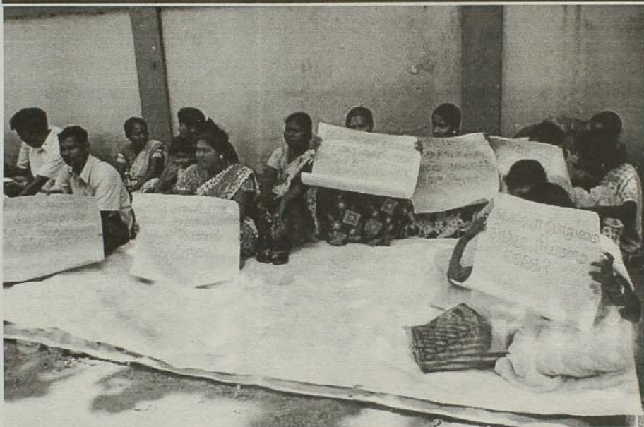
திருகோணமலை மாவட்ட தொண்டர் ஆசிரியர்கள் தமக்கு நிரந்தர நியமனம் வழங்குமாறு கோரி நேற்றுமுன்தினம் புதன்கிழமை முதல் சுழற்சி முறையிலான உண்ணாவிரதப் போராட்டத்தை மேற்கொண்டு வருகின்றனர்.