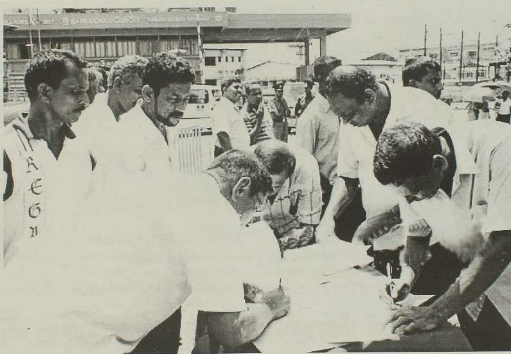
உத்தேச தனியார் ஓய்வூதிய சட்ட மூலத்தை எதிர்த்து கையெழுத்துப்பெறும் நடவடிக்கைகள் நேற்று முன்தினம் கொழும்பில் ஆரம்பமாகின. ஆயிரக் கணக்கான தனியார்துறை ஊழியர்கள் திரண்டு வந்து மகஜரில் கையொப்பமிட்டனர்.

இதற்கென 185 லட்சம் ரூபா அமைச்சினால் ஒதுக்கீடு செய்யப்பட்டுள்ளது. உள் ஹிட்டியாவ, தொடுவாவ, குறுசிபாடு, அம்பகந்தொடுவ ஆகிய நான்கு பிரதேசங்களிலேயே இந்த இறங்குதுறைகள் அமைக்கப்படவுள்ளன. (ச)