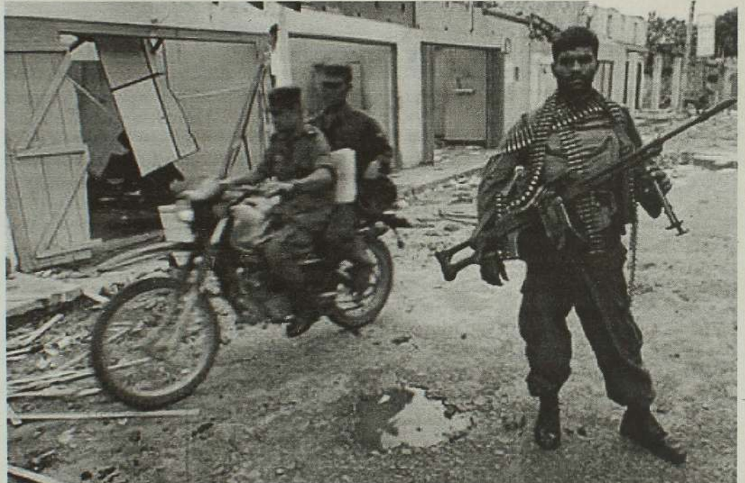
முல்லைத்தீவு மாவட்டத்தில் மீளக் குடியமர்த்தப்படாத புதுக்குடியிருப்புப் பிரதேசம் பெரும் அழிவுகளுக்கு உட்பட்ட நிலையில் காணப்படுகின்றது. இங்கு இன்னும் மீள் குடியமர்ப்பு இடம்பெறவில்லை.