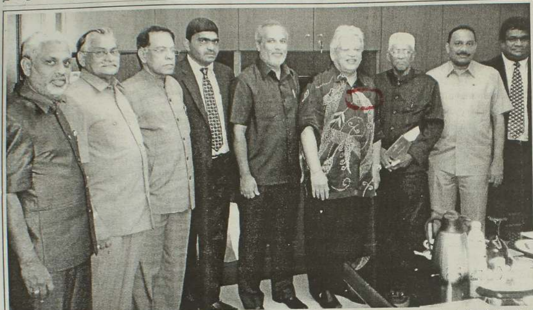
மலேஷிய அரசின் பிரதான கட்சியான அம்னோவின் செயலாளர் நாயகம் தாத்துக் செரி தெங்கு அத்தான் பின் தெங்கு மன்குரை இலங்கை நீதியமைச்சரும், ஸ்ரீ லங்கா முஸ்லிம் காங்கிரஸ் தலைவருமான ரஜிப் ஹக்கீமும் கட்சியின் உயர் மட்டக் குழுவினரும் கோலாலம்பூரில் சந்தித்துப் பேச்சு நடத்திய போது...