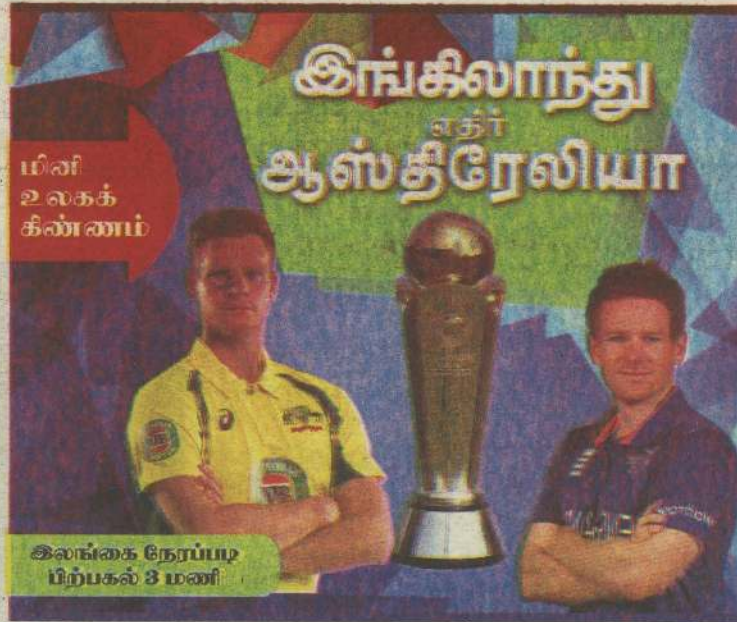
இலங்கை நேரப்படி பிற்பகல் 3 மணி

இங்கிலாந்து ஆடுகளங்களில் அதிக சராசரி வைத்துள்ளவரும் தவானே. இதன்படி 11 ஆட்டங்களில் விளையாடியுள்ள தவான் 711 ஓட்டங்களை எடுத்துள்ளார். சராசரி 79.00 ஆக உள்ளது. மேற்கிந்தியத் தீவுகளின் முன்னாள் ஜாம்பவான் வில் ரிச்சர்ட்ஸ் 31 ஆட்டங்களில் விளையாடி ஆயிரத்து 345 ஓட்டங்களைப் பெற்றுள்ளார். சராசரி 64.04 என்று உள்ளது. இது இரண்டாவது சிறந்த சராசரி. நியூசிலாந்து அணியின் தலைவர் வில்லியம்சன் 13 ஆட்டங்களில் 758 ஓட்டங்களைப் பெற்றுள்ளார். சராசரி 63.16 என்றுள்ளது. இது மூன்றாவது அதிகபட்சம். (ம)