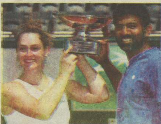
12:10 என்ற புள்ளிகளின் அடிப்படையில் கைப்பற்றி சம்பியனானது.

பன்னாட்டு அந்தஸ்து பெற்ற தொடர்களில் ஒன்றான பிரான்ஸ் தொடரில், நேற்றுமுன்தினம் நடைபெற்ற கலப்பு இரட்டையர் பிரிவு இறுதி ஆட்டத்தில் போபன்னா (இந்தியா), கபிரியேலா இணை கிண்ணம் வென்றது. பரிஸ் நகரில் இந்த ஆட்டம் நடைபெற்றது. போபன்னா - கபிரியேலா இணையை எதிர்த்து ரொபேர்டா (கொலம்பியா), அன்னலெனா (ஜெர்மனி) இணையை எதிர் கொண்டது. முதல் செற்றை 2:6 என்ற புள்ளிகளின் அடிப்படையில் போபன்னா இணை இழந்தது. இரண்டாவது செற்றை 6:2 என்ற புள்ளிகளின் அடிப்படையில் கைப்பற்றி பதிலடி கொடுத்தது போபன்னா இணை. அந்த இணை மூன்றாவது செற்றை