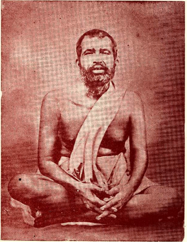
ஸ்ரீ ஸ்ரீ ராமகிருஷ்ண பரமஹம்ஸர்