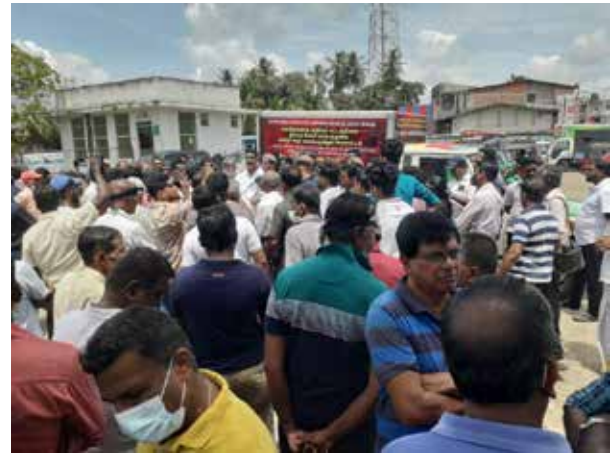
பயங்கரவாத தடுப்பு சட்டம்: