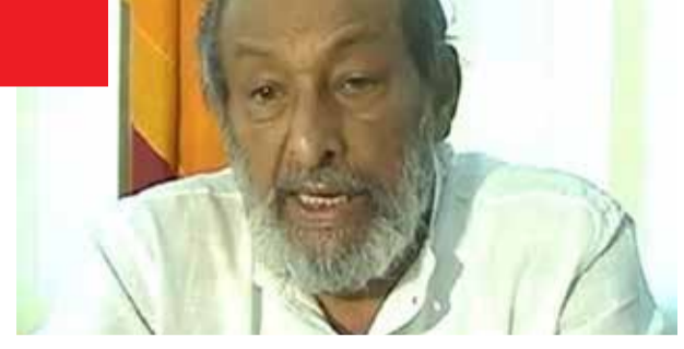
மீது நம்பிக்கை கொள்ள முடியாது என்றும் வாசுதேவ நாணயக்கார குறிப்பிட்டுள்ளார்.

மனித உரிமைகள் பேரவையில் ஜனாதிபதி ரணில் விக்கிரமசிங்க அமெரிக்காவின் நிகழ்ச்சி நிரலுக்கமையவே செயற்படுவார் என்றும் அவரது வாக்குறுதிகள்