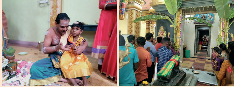
நுவரெலியா கிரேண்ட் ஹோட்டலில் விஜயதசமி பூஜை நேற்று (05) வெகு விமரிசையாக நடைபெற்றது. இந்தப் பூஜைகளை ஏற்பாடுகளை நுவரெலியா கிரேண்ட் ஹோட்டல் நலன்புரி சேவை மன்றத்தினர் செய்திருந்தனர். (எல்.கே குமார்)