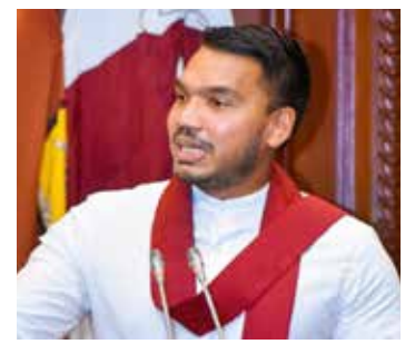
பதி மகிந்த ராஜபக்ஷ தலைமை தாங்கியதோடு, இந்நிகழ்வில் பிரதமர் தினேஷ் குணவர்தனவும் கலந்து கொண்டமை குறிப்பிடத்தக்கது. (அ)

வோம் - கருத்துறையில் இருந்து ஆரம்பிப்போம்' என்ற தலைப்பில் ஏற்பாடு செய்யப்பட்ட பொதுக்கூட்டம் நேற்றுக் காலை பாராளுமன்ற உறுப்பினர் ரோஹித அபேகுணவர்தனவின் கருத்துறை மாவட்ட ஒருங்கிணைப்புக் காரியாலயத்தில் இடம்பெற்றது. இதற்கு முன்னாள் ஜனாதி