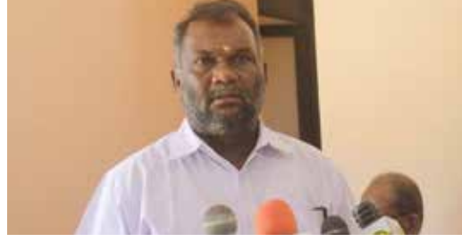
கொழும்பு, ஒக். 09

பாராளுமன்றத்தில் வருகின்ற திருத்தச் சட்டங்களெல்லாம் மக்களின் பிரச்சனைகளைத் தீர்ப்பதற்காக அல்லாமல் ஒரு சிலரது, ஒரு சில கட்சிகளது விருப்பங்களை நிறைவேற்றுவதற்காகவே கொண்டு வரப்படுகின்றன. அந்த அடிப்படையிலேயே 22ஆவது திருத்தச் சட்டத்தின் விவாதமும் பிற்போடப்பட்டுள்ளது என தமிழ்த் தேசியக் கூட்டமைப்பின் பாராளுமன்ற உறுப்பினரும், தமிழ்ஈழ விடுதலை இயக்கத்தின் செயலாளர் நாயகமுமான கோவிந்தன் கருணாகரம் (ஜனா) தெரிவித்தார்.