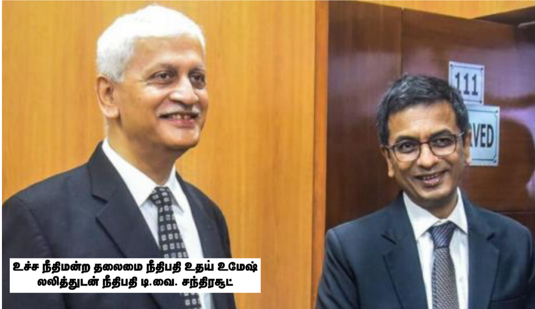
உச்ச நீதிமன்ற தலைமை நீதிபதி உதய் உமேஷ் லலித்துடன் நீதிபதி டி.வை. சந்திரகூட்

புதுடெல்லி, ஓக்.12 இந்திய உச்சநீதிமன்றத்தின் அடுத்த தலைமை நீதிபதியாக டி.வை.சந்திரகூட் பெயரை, தற்போதைய தலைமை நீதிபதி உதய் உமேஷ் லலித் பரிந்துரை செய்துள்ளார்.