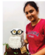
HESHI CAKE'S MAYURAN HESHIKA