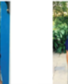
SHAKSHI BEAUTY CARE ANUSHANTHI