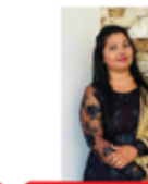
ADASHA BEAUTY CARE MARAN JENUSHA