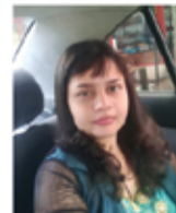
SHAL CAKES SHIYALIN HENDRICK