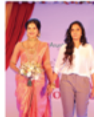
IVEHERALS BEAUTY CARE IVENTHINI PERINPARAJA