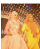
ALEEZA BEAUTY PARLOUR NUSKA NAHEM