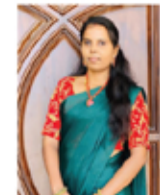
SWEETART CAKEDSIGN JEYARASA VARANIYA