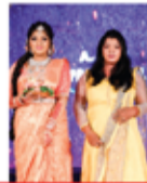
ADHISHAYAA BRIDAL STUDIO JENI