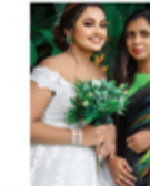
BRUNTHA BEAUTY PARLOUR PUSHPARATHNAM PIRASHANTHINI