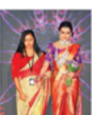
ANGEL BEAUTY CARE MITHUJAN SUMITHA