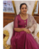
PRAKASHY BRIDAL & BEAUTY CARE PRAVEENA PRASATH