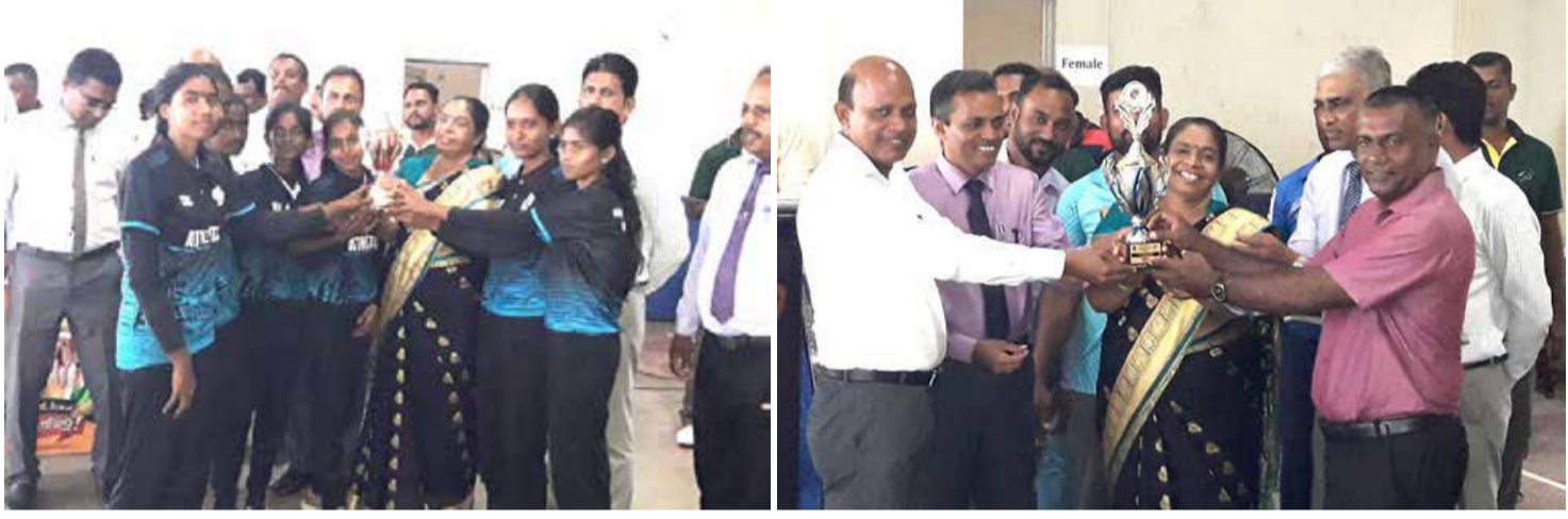
மூன்றாம் இடத்தையும், அக்கரைப்பற்று கல்வி வலயம் 85 புள்ளிகளைப் பெற்று நான்காம் இடத்தையும், தெகியத்தகண்டி கல்வி வலயம் 82 புள்ளிகளைப் பெற்று ஐந்தாம் இடத்தையும், அம்பாறை கல்வி வலயம் 68 புள்ளிகளைப் பெற்று ஆறாம் இடத்தையும், கிண்ணியாகல்வி வலயம் 64 புள்ளிகளைப் பெற்று ஏழாம் இடத்தையும், திருகோணமலை கல்வி வலயம் 59 புள்ளிகளைப் பெற்று எட்டாவது இடத்தையும், மட்டக்களப்பு கல்வி வலயம் 55 புள்ளிகளைப் பெற்று ஒன்பதாம் இடத்தையும், மட்டக்களப்பு மேற்கு கல்வி வலயம் 53 புள்ளிகளைப் பெற்று பத்தாவது இடத்தையும் பெற்றுக்கொண்டுள்ளது. மட்டக்களப்பு மத்தி (52), திருக்கோவில் (45), மகோயா (33), திருகோணமலை வடக்கு (15), மற்றும் முதூர் (15), கல்குடா (8), சம்மாந்துறை (5), போன்ற கல்வி வலயங்கள் முறையே பதினொன்றிலிருந்து பதினேழு வரை தெகிவாகியிருந்தன. முதல் மூன்று இடங்களைப் பெற்ற கல்வி வலயங்களுக்கு பணப்பரிசில்களும் வழங்கி வைக்கப்பட்டன. இறுதி நிகழ்வில் பிரதம அதிதியாக கிழக்கு மாகாண கல்விப் பணிப்பாளர் திருமதி புள்ளைநாயகம், கந்தளாய் வலக்கல்விப் பணிப்பாளர் ஏ.டபிள்யூ. தருமத்திலக்க, கிண்ணியா, பட்டிருப்பு, மற்றும் முதூர், திருகோணமலை போன்ற கல்வி வலயங்களின் உடற்கல்விப் பணிப்பாளர்கள் உட்பட அதிபர்கள், ஆசிரியர்கள் பெருந்திரலான வீர வீராங்கனைகளும் கலந்து சிறப்பித்தார்கள்.

கிழக்கு மாகாண பாடசாலைகளுக்கிடையிலான மெய்வல்லுனர் விளையாட்டுப் போட்டிகளில் பட்டிருப்பு கல்வி வலயம் 194 புள்ளிகளைப் பெற்று சம்மியனாக தேரிவு செய்யப்பட்டுள்ளது. கிழக்கு மாகாணத்திலுள்ள பதினேழு கல்வி வலயங்களுக்கிடையிலான விளையாட்டுப் போட்டிகள் கந்தளாய் லீவாரத்தின பொது விளையாட்டு மைதானத்தில் கடந்த செவ்வாய்கிழமை (5) உத்தியோகபூர்வமாக ஆரம்பமாகின. இதில் மூவாரத்திற்கும் மேற்பட்ட வீர வீராங்கனைகள் பங்குபற்றியிருந்தார்கள். ஐந்து நாட்களாக நடைபெற்று முடிந்த விளையாட்டுப் போட்டிகளில் இறுதி நிகழ்வுகள் ஞாயிற்றுக்கிழமை (9) நடைபெற்றன. இதில் கல்முனை கல்வி வலயம் 94 புள்ளிகளைப் பெற்று இரண்டாம் இடத்தையும், கந்தளாய் கல்வி வலயம் 88 புள்ளிகளைப் பெற்று