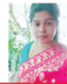
PRANI BEAUTY CARE KOWSALA NADARASA