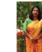
PREITY ASVI MAKEUP SALON THAJEEVARAN SUYIKA