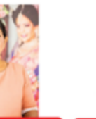
SHARP LOOK BEAUTY SALOON RAJITHARAN NELUKA