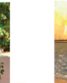
NIVE BEAUTY PARLOUR KIRUSHNAPILLA NIVETHA