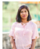
NITHI'S BEAUTY PARLOUR NITHIYA