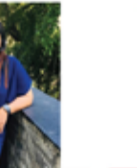
SHARU BRIDLE & BEAUTY CARE S.THATHAYINI