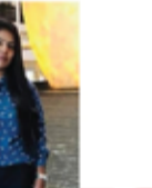
TOUCH OF BEAUTY SALON GAVASKAR DINISHAA