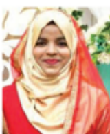
MADYAN HALAWA BAKE HOUSE RAFAIDEN FATHIMA RIZKA