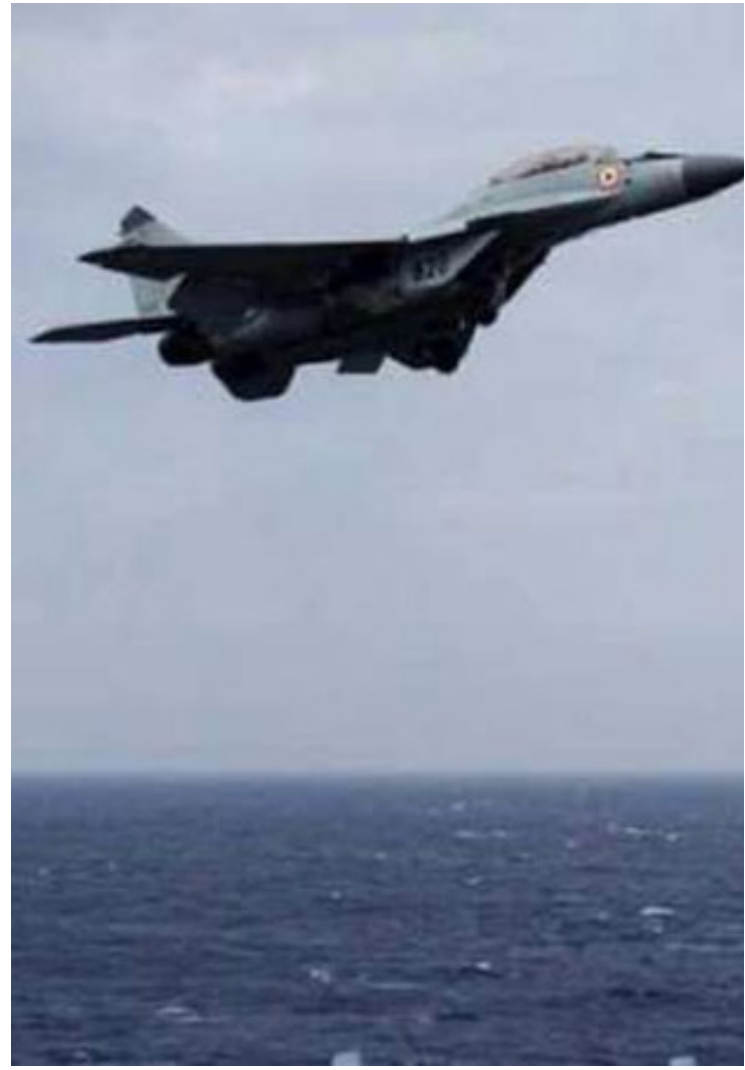
பானாஜி, அக். 12

கோவா கடற்கரை அருகே பயிற்சியில் ஈடுபட்டிருந்த மிக் 29கே போர் விமானம் கடலில் விழுந்து விபத்துக்குள்ளானது.