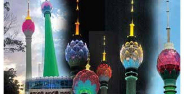
கட்டணமாக 8,665,612 அமெரிக்க டொலரும் செலுத்தப்பட்டுள்ளது.

அத்துடன், ஆலோசனைக் கட்டணமாக 33 கோடியே 74 லட்சத்து 85 ஆயிரத்து 20 ரூபாவும் கடன் உறுதி மற்றும் நிர்வாகக் கட்டணங்களுக்காக 22 கோடியே 23 லட்சத்து 69 ஆயிரத்து 357 ரூபாவும் செலவிடப்பட்டுள்ளது. தண்ணீர் மற்றும் மின்சாரம் வழங்குதல் ஆகிய செலவினங்கள் உள்ளடங்கலாக இதர செலவுகளுக்காக மொத்தம் 34 கோடியே 42 லட்சத்து 15 ஆயிரத்து 750 ரூபாவும் செலவிடப்பட்டுள்ளதாகத் தெரிவிக்கப்பட்டுள்ளது. நகர அபிவிருத்தி அதிகாரசபையின் நிலத்துக்கான கட்டணமாக 2 கோடியே 250 லட்சம் ரூபாவும் காப்பீட்டுக்