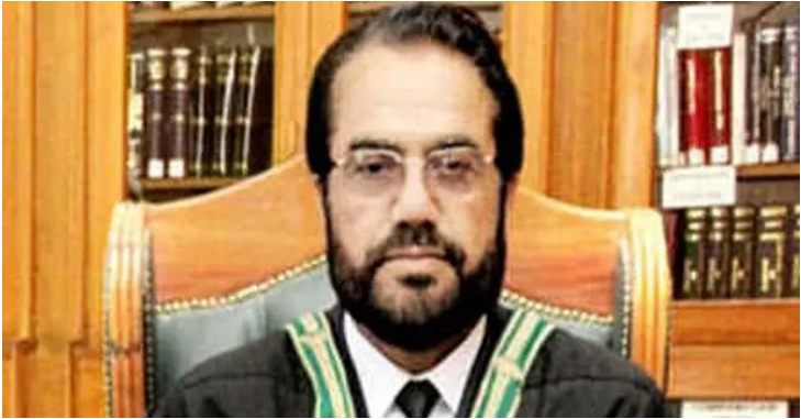
இஸ்லாமாபாத், ஒக்.16 பாகிஸ்தானின் பவுசிஸ்தான் மாகாணத்தின் முன்னாள் தலைமை நீதிபதி ஒருவர் பயங்கரவாதிகள்