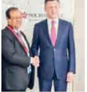
இந்த சந்திப்பில் இலங்கைக்கு னரிவாரான் பெறுவது குறித்து கலந்துரையாடல் மேற்கொண்டனர்.

ரஷ்யாவிற்கு உத்தியோக பூர்வ விஜயம் மேற்கொண்டுள்ள வளைந்தி சுசில் பிரதமரின் முன்னிலையில் சந்திப்பு நடந்தது. அதில் ரஷ்யா அரசின் உறுப்பினர்கள் ரஷ்ய அரசின் உறுப்பினர்களை சந்தித்து உடனடி நடவடிக்கை மேற்கொள்ளும் பற்றி இவர்களுடன் உறுப்பினர்களின் கலந்துரையும் நடந்தது.