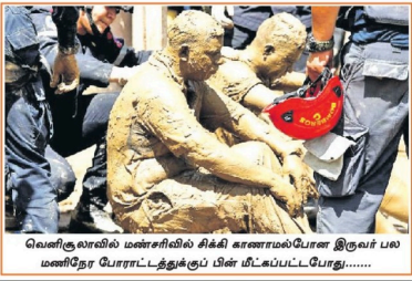
வெளிலாவில் மணலில் சிக்கி காணாமல்போன இருவர் பல மணிநேர போராட்டத்துக்குப் பின் மீடப்பட்டபோது.....