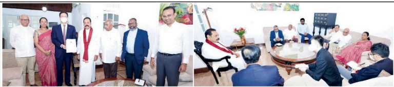
சீமந்த தூவல் எல் சென்ட்ராலில் மற்றும் முன்னாள் பிரதமர் மணிநாத் ராஜக்சேஷ் கும் இடையிலான சந்திப்பின் பின்பு (17) கொழும்பில் இடம் பெற்றது. நாட்டில் தற்போதுள்ள நிலைமை குறித்து இந்நேரத்தில் உடனடி நடவடிக்கைகளை மேற்கொள்ளும் பற்றி இவர்களுடன் உறுப்பினர்களின் கலந்துரையும் நடந்தது.