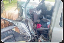
அறநாகரம் - பாடுவியை விடையில் இடம்பெற்ற வாளை விபத்தில் மூவர் உயிரிழந்துள்ளனர். இந்த விபத்துச் சம்பவம் நேற்று (17) இடம்பெற்றது. அத்துடன் அவர்கள் பயணித்த மரத்தின் மொதியே விபத்து இடம்பெற்றது என்று பொலிஸார் தெரிவித்தனர். மேலும் இவ்விபத்துச் சம்பவம் குறித்து மேலதிக விசாரணை பொலிஸார் மேற்கொண்டு வருகின்றனர்.