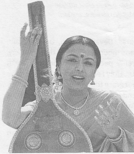
Famous Indian - Karnatak Vocalist Sudha Ragunathan

The first Chinese to take part in a contest featuring ancient Tamil Songs Comes in fourth