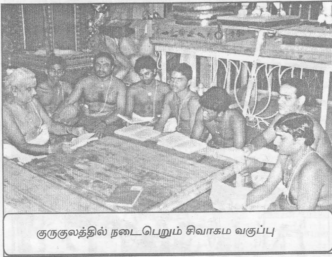
குருகுலத்தில் நடைபெறும் சிவாகம வகுப்பு