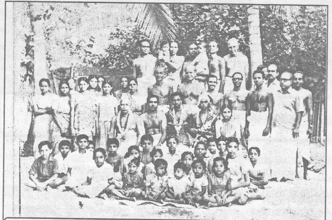
பல்லாண்டுகளின் முன்னர் குருகுலத்தில் நிகழ்ந்த ஒரு உபநயன நிகழ்வு.

"இப்படியான ஒரு நிறுவனத்தை உருவாக்க வேண்டும் என்பது என் இலட்சியமாக இருக்கவில்லை. சில சந்தர்ப்ப சூழ்நிலைகள் ஒன்று திரண்டு என்னைக் கருவியாக்கிக் கொண்டன என்றுதான் சொல்ல வேண்டும்" என மிகவும் அடக்கத்துடன் கூறும் அவரை ஆச்சரியத்துடன் பார்க்கின்றோம். அவரிடம் பெற்றுக்கொண்ட சுவையான பல தகவல்களைச் சுருக்கமாகத் தருகின்றோம்.