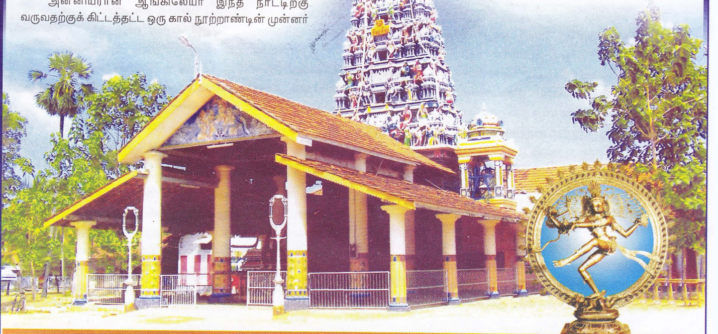
திருநெல்வேலி காயாரோஹணேஸ்வரர் கோயில் முகப்புத் கோற்றம்

1774 ஆம் ஆண்டிலே, திருமடந்தை நாத முதலியார் பரம்பரையினர் கட்டப்பெற்ற இந்தக் கோவில், கிழக்கே கோவில் வீதியையும் மேற்கே பலாலி வீதியையும் இணைக்கும் ஒரு சிறிய வீதிக்குத் தென்புறத்தே அமைதியும் அழகும் கோலோச்சும் சூழலில் அமைந்துள்ளது. இக்கோவிலின் வடக்கு வீதியின் ஒரு பகுதி எனச் சொல்லப்படக்கூடிய இடத்தில் அருள்மிகு முத்துமாரியம் பாள் ஆலயமும், வடகிழக்கில் தலங்காவற் பிள்ளையார் கோவிலும், தெற்குத் திசையில் வீரமாகாளி அம்பாள் ஆலயமும் அமைந்துள்ளன. பிரசித்தி பெற்ற நல்லூர்க்கந்தகவாமி கோவில் நல்லூர்க் கைலாசநாதர் சிவன்கோவில் ஆகியவற்றின் கண்டாமணி ஓசையை இங்கிருந்து கொண்டே மிகவும் தெளிவாகக் கேட்கலாம். தலங்காவற் பிள்ளையார், இக்கோவிலின் காவல் தெய்வமாகக் கருதப்படுகின்றபடியால், "காயாரோகண மூத்த நயினார்" என்றும் அவர் அழைக்கப்படுகின்றார்.