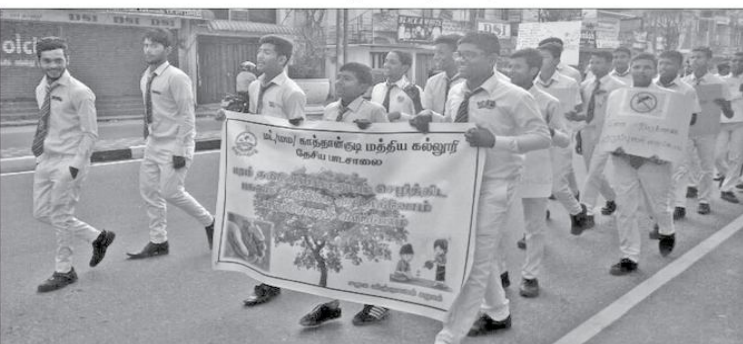
மட்டக்களப்பு கரத்தாங்குடி மத்திய கல்லூரி மாணவர்களும், ஆசிரியர்களும் இணைந்து உயிர்ப்பத்தை ஏற்படுத்தும் டெங்கு குறித்த விழிப்புணர்வுப் பேரணியை நேற்று நடந்தனர். மட்டக்களப்பு கல்முனை நெடுஞ்சாலை வழியாக டெங்கு குறித்த பதாகைகளைத் தாங்கியவாறு பேரணி சென்றதுடன் டெங்கு பற்றிய கையேடுகளும் விநியோகிக்கப்பட்டன. (ஏறாஜர் ஏ.எச்.ஏ. ஹாஸன்)