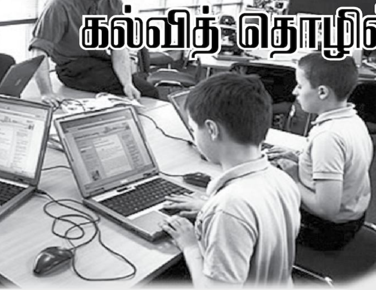
மாணவர் மையம் மாணவர்களுக்கு கல்வி கற்றல் - கற்பித்தல் தொழிற் பரம்பரையை மீட்டும் பொருள் கல்வி சமூக முதலீடு என்ற அடிப்படையில், சமூக நியமில் ஆசிரியர்கள் முக்கியத்துவம் பெறுகின்றனர். ஆசிரியர் மையம் கல்வி எண்ணக்கரு