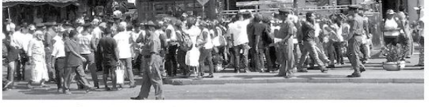
னாள் ஆண்டு கோலம் மரணமாகும் குழந்தைகள் மற்றும் சிறுவர்களைப் பாதுகாப்பதற்காக, 200 கேரூ குரபு கொலாவில், முழுமையான மரண மர வர்த்திகளைக் கொண்டு கோல அலங்கார சிகிச்சை மற்றும் அறி தீவிர சிகிச்சைப் பிரிவெனவற்ற உருவாக்குவதற்கான நிதியைத் திரட்டுவதற்காகவே, இந்தப் பாத யாத்திரை எழுங்கு செய்யப்பட்டதாக, கொலைக்

(மதுவாய்க்கொடை திருபூர்) சிறிய இயத்துக்குக் ககம் தாருங்கள் என்ற மனித நேயத்துக்கான பாத யாத்திரை, இலங்கை சிறுவர் நோய் நிபுணர்களின் நிறுவனத்தால், கொழும்பில் தேற்ற நடத்தப்பட்டது. தேற்றக் காவை 8 மணி முதல் - மாலை 5 மணி வரை, கோழும்பு - கோட்டை, பறக்கோட்டை, மருதானை, பொரணை, கொம்பனி வீதி, வேக் ஹவுல் கற்று வட்டம், விரா மகாதேவி பூங்கா என்பவரும் வகையில் இடம்பெற்று இந்தப் பாத யாத்திரையின், கமர் ஆசிரியர்களின் மேற்பட்ட இன ஒருங்கிணைப்புக் கலந்து கொள்ளினர். சிரச தொலைக் காட்சி நிறுவனம், பொரணை சிறுவர் வைத்தியசாலையுடன் இணைந்து, இந்தப் பாத யாத்திரையை ஏற்பாடு செய்திருந்தது. இதய நோய்க்கி