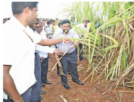
(சுப்பு காரி) நாட்டின் கரும்புச்செய்கையில் தன்னிறைவுபெற்று வெளிநாடுகளை இருந்து

பெல்வத்த கரும்பு அறுவடை விழாவில் அமைச்சர் ரிஷாத்