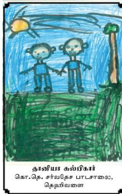
தாயியா கல்பீகர் கொ.தெ. சர்வதேச பாடசாலை, தென்விவரை