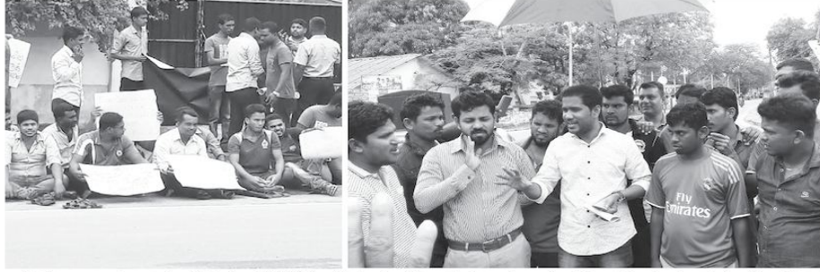
திருகோணமலை மாவட்டத்திலுள்ள 400 இடங்கு மேற்பட்ட வேலையற்ற பட்டதாரிகளின் ஆர்ப்பாட்டம் கின்னியா சிறுவர் பூங்காவிற்கு முன்னால் வியாழக்கிழமை இடம்பெற்றபோது பிடிக்கப்பட்ட படங்கள்கள்.