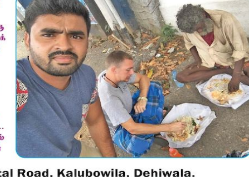
156, Hospital Road, Kalubowila, Dehiwala.

கறையானை ஆஸ்பத்திரி வீதியில் அலைந்து திரியும் பிச்சைக்காரன். அவனுடன் ஒரு வெள்ளைக்காரன் உணவாகும் கொண்டிருக்கின்றான். பிச்சைக்காரனைக் கண்டபோது ஹக்கப்பிரித்துக் கொண்டு திரவிலிக் ஓடுவர். அவர் மருந்து வீசும் தூர் - நற்றம் அப்படி. இரக்க சீதகனையும் மனக் நேயமும் மிக இக்கட்சியை... நான்கு வரிக் கவிதையாக்கினால் என்ன, எங்கே உங்கள் பேசாமு பேசும்...?