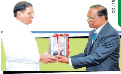
புதிய பிரதம நீதியரசரின் முன்னுள்ள எதிர்பார்ப்புகள்