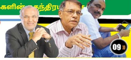
மு.கா. எதிர் கூட்டணியின் சாத்தியப்பாடுகள்