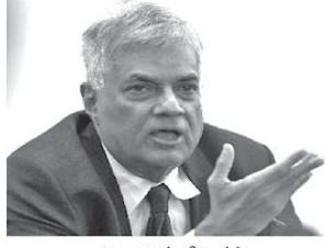
அ.அருண் பிரசாந்த் மலர்ந்த அரசின் இடம்பெற்ற இலஞ்ச, அறங்களை விசாரணை செய்யவந்ததாக ஸ்தம்பிக்கப்பட்ட ஜனாதிபதி ஆணைக்குழுவுக்கு செயல்பட்ட முறைப்பாடுகளின் 158 தொடர்விசாரணைகள்

முடிவடைந்து விட்டதாகவும், இதுவியம் தொடர்பில் அடுத்தகட்ட நடவடிக்கை மீனை மேற்கொள்ள சட்டமா அறிபுக்கும் குறித்த முறைப்பாடுகள் அனுப்பி வைக்கப்பட்ட நேரங்களிலும் பிரதமர் ரணில் விக்கிரமசிங்க தெரிவித்தார்.