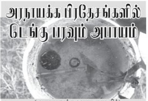
அரணாயக்க பரா தகவிரி அரணாயக்க- திப்பியா, விடப்பொலை பிரதேசத்தில் டெய்லு பரவலுக்கான அபிதானம் இருப்பதாகவும், சுற்றுக் குழுவை சுத்தமாக வைத்துக்கொள்ளும்படியும் விடப்பொலை கிராம உத்தியோகத்தி வேண்டு கோள் விடுத்துள்ளார். டெய்லு பரவல் அவதானம் உள்ள இடங்களை பரிசீலிப்பதற்கான மேற்படிப் பிரதேசங்களுக்கு 10.11 ஆம் திகதிமீதல் கசுதார அறிக்கர்கள் வருகைத் தரவுள்ளதாகவும் கிராம உத்தியோகத்தி தெரிவித்தார். கசுதார அறிக்கர்கள் பரிசீலிக்கும் போது, டெய்லு பரவலுக்கு ஏதுவான விடயங்கள் சுற்றுக் குழுவில் கண்டிட்டுக் கப்பும் தொடர் தண்டப்பணம் மற்றும் வழக்குத் தொடர்வதற்கான நடவடிக்கைகள் எடுக்கும் போதும் என்றும் சுற்றுக் குழுவை சுத்தமாக வைத்துக்கொள்ளும்படியும் அவர் சீசரித்தார்.

விசாரணையுடன் மேலதிக விசாரணைகளை மேற்கொள்ளத் தேவையில்லை என்று ஆணைக்குழுவால் தீர்மானிக்கப்பட்டு நிறுத்தப்பட்டன. மேலும், தற்போது 400 முறைப்பாடுகள் தொடர்பில் விசாரணைகள் முன்னெடுக்கப்பட்டு வருகின்றன. அத்துடன், 158 முறைப்பாடுகள் தொடர்பில் விசாரணைகள் அனைத்தும் முடிவடைந்து விட்டன. இந்நிலையில், முறைப்பாடுகள் தொடர்பில் தண்டனை வழங்கும் அதிகாரம் இந்த ஆணைக்குழுவுக்கு இல்லாத காரணத்தினால் முடிவடைந்த விசாரணைகளை தற்போது குற்றப்படிவமாய்வு பிரிவினருக்கும் சட்டமா அறிபுக்கும் அனுப்பி வைத்துள்ளோம் என்றார்.