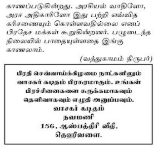
(வந்துகாமம் திருபர்) மீர்த் வசனம்மக்களும் நாகர்க்கால வாகர் கடிதம் பிறழாமும், உங்கன் பரிச்சைகளை சரக்கம்மாவும் கடைகாக்கவும் எழுத அனுப்பவும். வாசக் கடிதம் நவமணி 156, ஆல்பெர்ட் வீதி, நெடுவரை.

கண்டி - மஹியங்களை பிரதான வீதியை அமைத்துள்ள உண்மைகிரிய நகரில் பாகுது லூல்வத்தலை வரை செல்லும் பாகுது பல்வேறு இடங்களில் பயன்படுத்த முடியாத அளவிற்கு பழுதடைந்து