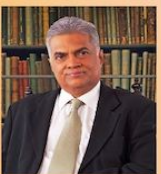
இலங்கை ஜனநாயக குடியரசின் பிரதமர்

பல்வேறு நுகர்வோர் உரிமைகளுக்கிடையேயும் மக்கள் எழும் பல்வேறு நுகர்வோர் உரிமைகள், திறந்த பொருளாதார முறையின் கீழ், நாட்டின் ஒவ்வொரு சமூகத்திற்கும் அங்குள்ளவர்கள் வழங்குதல், மற்றும் சர்வதேச சீர்தரம் பரவலாக்கி பொருள்பயன் திறந்த பொருளாதார உட்கட்டங்களில் மக்களின் பங்களிப்பை வழங்கும் முறை உருவாக்கப்படும். இலக்கம் கொள்ளும் முறை உருவாக்கப்படும். இலக்கம் கொள்ளும் முறை உருவாக்கப்படும்.