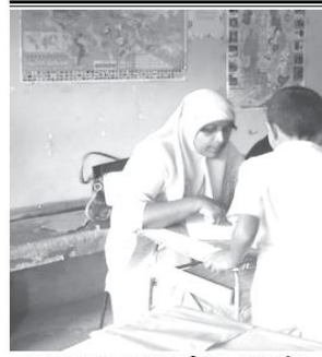
அரணயக்க தல்கஸ்பிடிய முஸ்லிம் மகா வித்தியாலயத்தின் மாணவர் பாராளுமன்றத் தேர்வுகள் அண்மையில் பாடசாலை பிரதான மண்டபத்தில் இடம்பெற்றது. மாணவர் பாராளுமன்ற உறுப்பினர்களைத் தெரிவுசெய்வதில் மாணவர்கள் ஆர்வமாக இருப்பதைத், தேர்தல் கடமையில் ஈடுபட்டிருந்த ஆசிரியர்களையும் படத்தில் காணலாம்.

பிரதமரின் நல்லிணக்கம் தொடர்பிலான செயலணியின் பரிந்துரைகள் பிரகாரம், இந்த நாட்டில் ஏற்பட்ட ஆதர்ப்பு போராட்டத்துக்கு, பிரதிவாதிகளில் மன்னிப்புக் கோரவேண்டும். எனினும், பயங்கரவாதிகள் அமைப்பு அல்லது அங்கங்களுக்கு உதவி ஒத்தாசை நடவடிக்கை அரசியல் அமைப்புகளில் மன்னிப்பு வேறு அரசியல் அமைப்புகளில் மன்னிப்பு வேண்டும்.