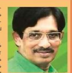
இலங்கை ஜனநாயக குடியரசின் பிரதமர்

மார்ச் 15ம் திகதி கொண்டாடப்படும் நுகர்வோர் உரிமைகள் தினம் உலக வாய்ப்பு அனைத்து நாடுகளிலும் மிக முக்கியமான நாளாகும். இம்முறை தொழில்நுட்பத்தின் கைத்தொழில் தோலாமை முக்கியத்துவத்தை பெற்று அனைத்து துறைகளிலும் சிந்தனையூட்டி வளம் தர வேண்டும்.