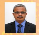
இலங்கை ஜனநாயக குடியரசின் பிரதமர்

நுகர்வோர் பாதுகாப்பான திறமையற்றதில் அதிக அச்சுறுத்தல்களை எதிர்கொள்ளும் துறை என்பது உத்தரவாசன அமைச்சின் மூலம் பாதுகாக்கப்படும் முறை உருவாக வேண்டும் என்பது இலக்கம்.