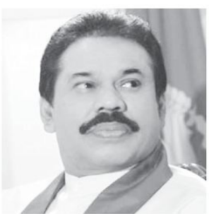
முடியும். இதன் ஊடாக ஒற்றையாட்சி இல்லாமல் செய்யப்பட்டு, பெடர்ஸ் ஆட்சி முறைமையொன்று உருவாக்கப்பட்டுள்ளது. இவ்வாறு அரசாங்கம், நாட்டின் சமாதானத்துக்கும் ஒற்றைமுகம் பங்கம் ஏற்படுத்தும் வகையில், தேர்தல்களாகமான வேலைத்திட்டத்தை முன்னெடுக்கின்றது என்பதனை சகலருக்கும் தெரிவித்து கொள்கின்றேன் என்றும் அவ்விதக்கையில் குறிப்பிடப்பட்டுள்ளது.

இடையூறுகளும் இந்த புதிய சட்டத்தின் உள்ளக்கப்படும் வகையிலேயே பிரதமரின் செயலணியினால் பரிந்துரைக்கப்பட்டுள்ளது. அவசரகாலச் சட்டத்தை மீறாமல் பரிந்துரப்படுத்தும், திறமைசூழ் அதிகாரம் கொண்ட ஜனநாயக திக்கு இருக்க அதிகாரங்கள் குறைக்கப்படும் வகையில், செயலணியினால் பரிந்துரைக்கப்பட்டிருக்கின்றன. இவை, மாகாணம் சிறுவையும் போடும், பொலிஸ், முப்படைகளின் கைகளை கட்டிவிடுவதாகும். இலங்கை மதம் இக்காலத் தாக்கம் பிரகாரம் பரிந்துரைக்கப்பட்டுள்ளது. மாகாண ஆளுநர்களின் சகல அதிகாரங்களையும் இல்லாமல் செய்து வதற்கு யோசனை முன்வைக்கப்பட்டுள்ளது. அதனுட்ப்படைமீதும், அந்த மாகாணத்தின் முதலமைச்சர்களால், தங்களுடைய விருப்பத்தின் பிரகாரம், ஆளுநர்களை நியமித்துள்ள முடியும். அதேபோல, அந்த அமைச்சரவையின் ஆலோசனையின் பிரகாரம் ஆளுநர் செயற்படும்.