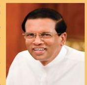
மைத்திரியால் சிர்சே இலங்கை ஜனநாயக குடியரசின் ஜனாதிபதி

ஐட்டில் யுகத்தின் நுகர்வோர் உரிமைகள் உருவாக்குவதன் உட்கட்டங்களாக உட்பட்ட பொருள்பயன் சேவை வழங்குகின்றன. எந்திர உருவாக்கத்தின் மையப் பகுதியில் நுகர்வோர் உரிமைகள் பெற்றுக் கொள்ளும் முறை உருவாக வேண்டும் என்பது இலக்கம். நுகர்வோர் தினத்தின்மீது நாட்டின் மையப் பகுதியில் நுகர்வோர் உரிமைகள் பெற்றுக் கொள்ளும் முறை உருவாக வேண்டும் என்பது இலக்கம். நுகர்வோர் தினத்தின்மீது நாட்டின் மையப் பகுதியில் நுகர்வோர் உரிமைகள் பெற்றுக் கொள்ளும் முறை உருவாக வேண்டும் என்பது இலக்கம்.