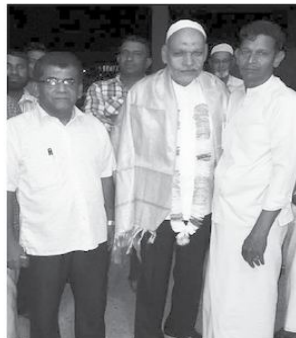
முன்னின்று உழைத்த சகலருக்கும் பாராட்டு