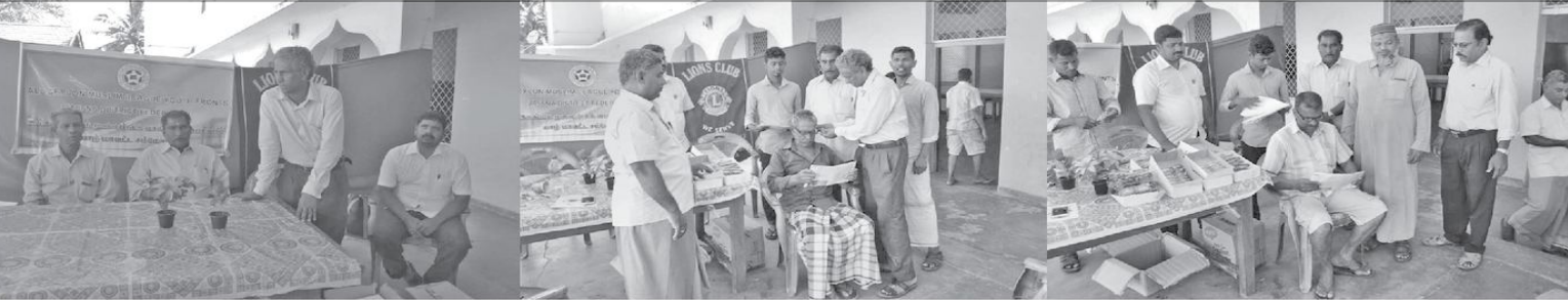
அகில இலங்கை முஸ்லிம் வீக் வாசிபு முன்னணிமீன் யாழ்.மாவட்ட சம்மேளனமும், யாழ்.நுழைவாயில் வயலில் கழகமும் இணைந்து நடாத்திய மூக்குக்கண்ணாடி வழங்கும் நிகழ்வு அண்மையில் யாழ். ஒஸ்மனிசாய்க் கல்லூரியில் இடம்பெற்றபோது பிடிக்கப்பட்ட படங்கள். (எம்.எல். வாயிர்)

பொருட்டே, இவ்வாறான முன்னேற்ற பாடுகள் மேற்கொள்ளப்பட்டுள்ளதாகவும் டாக்டர் தெரிவித்துள்ளார். எவ்வாறாயினும், இந்த வைரஸ் இப்பிரிவில் மேலும் பரவாமல் இருப்பதற்காக, பாதுகாப்புப் பெறும் நடவடிக்கைகள், மிகத் துரிதமாக முடக்கிவிடப்பட்டுள்ளன. தற்போது பணிகள் நிறைவடைந்ததும், ஒரு வார காலத்திற்கு இப்பிரிவை மீண்டும் திறப்பதற்கான ஒழுங்குகள் மேற்கொள்ளப்பட்டுமெனவும், இதனால் தொறியாத வைரஸ் அச்சம் கொள்ளத் தேவையில்லை எனவும் டாக்டர் விஜேசூரிய தெரிவித்தார்.