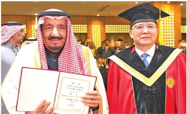
சீன - பெய்ஜிங் பல்கலைக் கழகம் வழங்கிய கௌரவ டாக்டர் பட்டத்தையும் பெற்றுக்கொண்ட சவுதி மன்னர் சல்மான்

நாட்டின் பொருளாதாரத்தை உயர்த்தும் நோக்கத்தில் சீனா, ஜப்பான், இந்தோனே சியா உள்ளிட்ட ஆசிய நாடுகளில் சுரு மாத கால அரகமுறை சுற்றுப்பயணத்தை நிறைவு செய்த சவுதி மன்னர் சல்மான் ரியாத் நகருக்கு திரும்பினார். பொருளாதார நெருக்கடியால் தள்ளாட்டம் போட்டுவரும் சவுதி அரே பியாவை சரிவிலிருந்து மீட்டுவது அரசின் புதிய பொருளாதார புனரமைப்பு திட்டத் துக்கு அந்தநாட்டின் அமைச்சரவை கடந்த ஆண்டு ஏப்ரல் மாதம் ஒப்புதல் அளித் தது. சர்வதேச சந்தையில் பெற்றோவின் விலை தொடர்ந்து குடுச்சரிவைச் சந்தித்து வருவதால் எண்ணெய் வளத்தை மட்டு மட்டு நம்பியுள்ள சவுதி உள்ளிட்ட வளை குடா நாடுகள் சம்பந்தமாக பொருளாதார