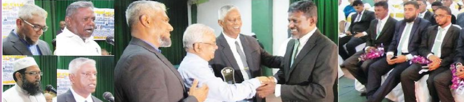
கொடும்பு-12, வாழைத்தோட்டம் அல்-ஹிமா கல்லூரி பழைய மாணவர்களின் பங்களிப்பின் படி மில்லியன் செலவில் 13 வகுப்பறைகளையும் ஒரு கேட்போர் கூடத்தையும் கொண்டு புதிய மாடிக் கூட்டத்தை பூரித்து செய்து கொடுத்ததையிட்டு அவர்களை கௌரவிக்கும் நிகழ்வு வாழைத்தோட்டம் அல்-ஹிமா கல்லூரியில் நிகழ்வு கொண்டுவந்து கொண்டிருக்கிறது. இங்கே காணப்படும் கட்டிடம் அல்-ஹிமா கல்லூரியில் நிகழ்வு கொண்டுவந்து கொண்டிருக்கிறது. இங்கே காணப்படும் கட்டிடம் அல்-ஹிமா கல்லூரியில் நிகழ்வு கொண்டுவந்து கொண்டிருக்கிறது.

16 பேர் காயம் அவிலிஸ்டாலையில், ஊடுபெடிய பிரதேசத்தில் தேர்தல் இடம்பெற்று வாகன விபத்தில் 16 பேர் காயமடைந்துள்ளனர். மரண வீடானதற்கு சென்றிருந்து குழுவினர் பயணித்த வேள் ஒன்று இவ்வாறு கமரம் 50 அடி பள்ளத்தில் வீழ்ந்து விபத்துக்குள்ளானது. காயமடைந்தவர்களுக்கு 8 பேர் பெண்கள் எனவும், இரண்டு பேர் சிறார்கள் எனவும் தெரியவந்துள்ளது. அவர்கள் கோவை மற்றும் தெரனி கோவை பிரதேசத்தில் வசிப்பவர்கள் என விரிவுபடுத்தும் திருந்து தெரிவியும் உள்ளது. சாதாரண நிகழ்வு ஏற்பட்டதே இந்த அனர்த்தத்திற்கு காரணம் என தெரிவிக்கப்பட்டுள்ளது. இதேவேளை, மொட்டூவ கடைமீட்டல் மீதான திருந்து வாகன விபத்தில் 3 பேர் மரணித்து சம்பவம் தொடர்பில் திருச்சுவாதிக்கை மத்தியில் அமைதியற்ற நிலை ஏற்பட்டிருந்தது. தனியார் பஸ் ஒன்று வேகத்தில் சென்றபோது முயற்சி நிலையில் முன்னால் சென்ற வெற்றி லீடியர், அருகே இந்த பஸ் தாழ்ந்தும் லீடியர் மோதியதில் தேர்தலுள்ளும் ஏற்று பேர்ப்பலியாகியுள்ளார். விபத்துக்கு காரணமான சாதாரண ஏனோர் நிர்த்தேசவாரிக் ஆர்ப்பாட்டம் மீறிகொண்டிருந்தோர், அவர்கள் மோட்டூவ பாலில் நிலையத்திற்கு சென்று ஏற்பட்ட மரணங்களுக்கு நியாய கோரியுள்ளமையும் குறிப்பிடத்தக்கது.