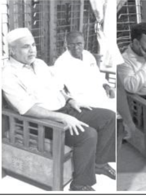
கல்பிட்டி பிரதேச செயலகப்பிரிவுக்குட்பட்ட சுவசக்தி அமைப்பு கூட்டம் 18 ஆம் திகதி காலை 9.30 மணிக்கு கல்பிட்டி பிரதேச செயலக காரியாலயம் பழைய கூட்டக் கூடத்தில் நடைபெற்று வருகிறது.