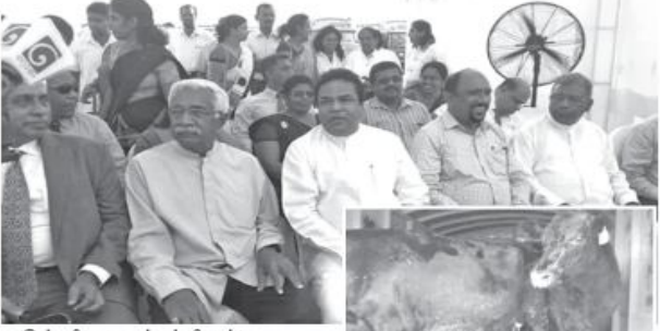
(இன்னிவா ஏ.ஆர்.எம்.நிபாஸ்) ரிஸாலிப் பொருளாதார அபிவிருத்தி அமைச்சரவைக் குடும்ப அமைச்சர் (13) திருகோணமலை சேலக் குடும்ப அமைச்சர்

தெருமுத்தத்தில் 2000 கறவைப் பசுக்கள் நியூலாந்தில் இருந்து கொண்டு வரப்பட்டு ஊரா, மத்திய மாகாணங்களில் உள்ள பரந்த பண்ணையாளர்களுக்கு வழங்கப்பட்டது.