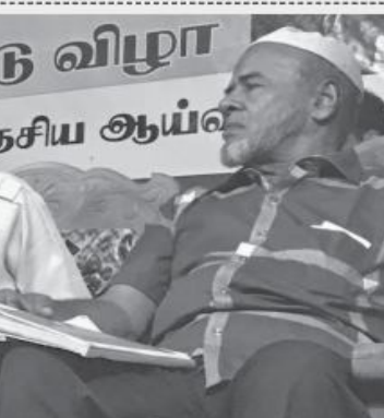
இக்க பின்வரவது முஸ்லிம் அரசியல் பிரதானிகள் வழிகாட்டலை கருத்துக் கொடுத்து முஸ்லிம் தலைவர்க்கும் கட்டிகள் செய்து வேண்டியிருப்பது காலத்தின் கட்டளையாகும். நயது வரலான இதில் அக்கரைப்பற்றின் இராண்டு கன் கணையே நாளும் சகோதரர் தேசு இல்

வடக்கு கிழக்கின் நிறந்தர அமைதிவையும் சமாதானத்தையும் உறுதிப்படுத்தவது வட கிழக்குத் தமிழர்களினதும் முஸ்லிம்களினதும் சம அதிகாரப் பங்கீட்டிவேயே பெரிதும் தக்கியுள்ளது. உரையாற்றிய முத்திரை முறைகளை வடக்கு கிழக்கு தமிழர்களுக்கு அகிராரப் பரவலாக்கத்தின் கீழ் மாசான மட்டத்தில் அதிகாரம் வழங்கப்பட்ட இருப்பதாகவும் வடக்கு கிழக்கு தற்காலமீதமாக இணைக்கப்பட்டு வடகிழக்கு மாசான சபை உருவாக்கப்பட்ட இருப்பதாகவும் 1986இல் செய்திகள் உறுதிப்படுத்தின. அவ்வாறான வடக்கு கிழக்கினுள்ள முஸ்லிம்களை ஒருங்கிணைத்து ஒரு முஸ்லிம் பெருப்பாண்மை மாசான சபை உருவாக்கப்பட வேண்டும் என்று சிந்தனைபயை முழு இலங்கையிலும் முன்முதல்முள் முன் வைத்து கிழக்கியல்கை முஸ்லிம் முன்னவரி தாய், அன்னை தலைவராக நாளும் செயலாணராக சகோதரர் தேசு இல்லத்தினும் முஸ்லிம் பெருப்பாண்மை மாசான சபைகளை கோரிக்கையை முன்வைக்கப்பட வேண்டுகின்ற கிழக்கியல்கை முஸ்லிம்கள் வாலிவாக தொடர்ச்சியாக தெரியப்படுத்தி வருகிறோம். 1986 தாய்ப் 29இல் கொழும்பு பாசன விவாசிய தேசு இல்லத்தினர் வழிகாட்டலில் நடைபெற்ற முஸ்லிம் காங்கிரஸ் ஆறாவது தேசிய மாநாட்டில் அன்னை தலைவரிடம் அவர்கள் முஸ்லிம் பெருப்பாண்மை மாசான சபைக் கான கோரிக்கையை முன் வைக்கும் ஆலோசனை தேசு இல்லத்தினர் முன்புடுத்தப்பட்டது. 1986இல் நடைபெற்ற தந்தையிமாசன இணைக்கப்பட்ட வடகிழக்கு மாசான சபைக் தேசியத் தலைவரிடம் காங்கிரஸ் போட்டியில் வென்ற பெருமுழு முஸ்லிம்தினும் அத்தேசியில் கிழக்கு மாசானத்தின் 17 மாசான சபை உறுப்பினர்களை வென்றெடுப்பதற்கும்