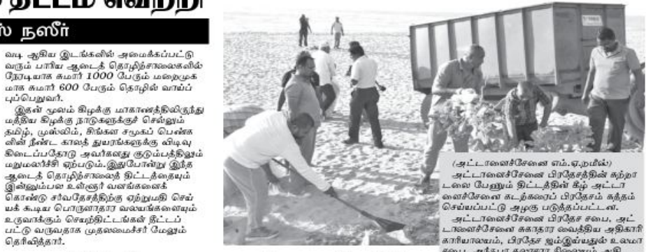
அட்டாளைச்சேனை எம்.ஏ.எம். ரிஸாலிப் கலிஷ்ட பதவரி முறையில் அட்டாளைச்சேனை கடற்கரை பிரதேசத்தை சுத்தம் செய்யும் வேலைத்திட்டம்