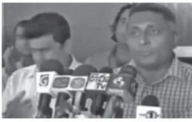
முஸ்லிம் மக்களும் முஸ்லிம் அரசியல் வாதிகளும் அவர்கள் வாய் பிடித்த அலைவழி கலைக்கப்பட்டு விடாமலும்.

இலங்கையில் தப்லீக் ஜமாஅத் மீது மீதான கெடுபிடிகளை தளர்த்துவதற்கு அரசுக்கு அழுத்தம் கொடுக்கவேண்டும்; எதிர்ணி பிரமுகர் இப்பால்