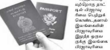
சுதந்திரப்படி மத்திய நாட்டில் பிரஜைமையை பெற்றுக்கொண்டதனால் இலங்கைகளை பிரஜைமையை இழந்த ஒருவருக்கு இலங்கை பிரஜைமையை