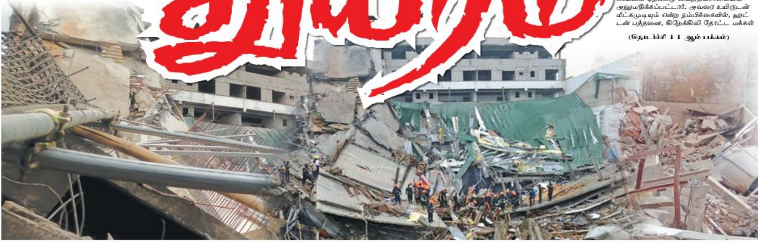
(தே. 18 11 ஆம் பக்கம்)