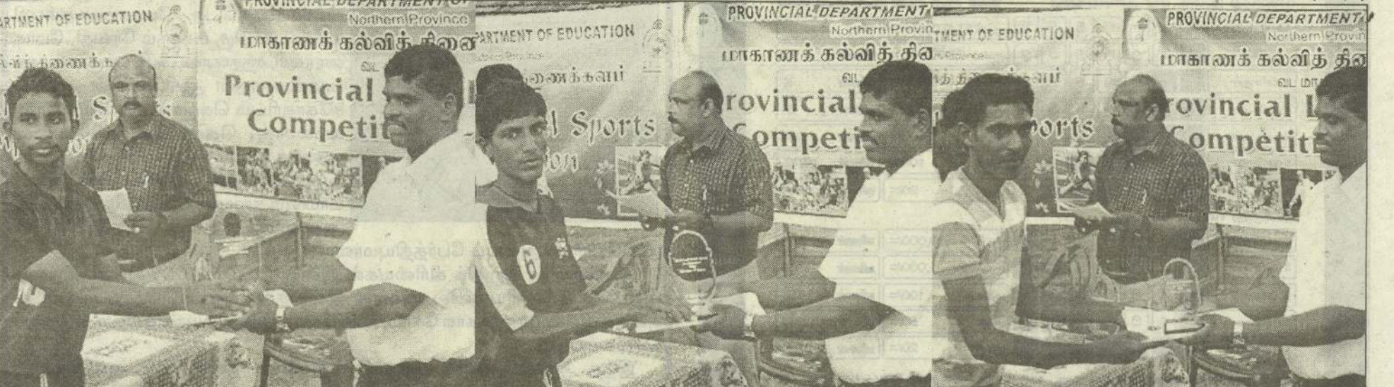
வடமாகாண கல்வித் திணைக்களம் மாவட்டப் பாடசாலை அணிகளுக்கு இடையே நடத்திய 19 வயதுப்பிரிவு ஆண்களுக்கான உதைபந்தாட்டச் சுற்றுப் போட்டியில் முதலாவது இடத்தினைப் பெற்ற மாவப்பாய் இந்துக் கல்லூரி, இரண்டாம் இடத்தைப் பெற்ற இளவாலை சென். ஹென்றீஸ் கல்லூரி, மூன்றாம் இடத்தை பெற்ற மன்னார் சென். சேவியர் ஆண்கள் கல்லூரிகளின் தலைவர்கள் வலிகாமம் கல்வி வலயக் கணக்காளர் கே. கமலநுபரிடம் இருந்து வெற்றிக் கிண்ணங்களைப் பெறுவதற்காகப் பாடங்களில் காணலாம். (படங்கள் : தமிழினியன்)

யாட்டுக்கழக அணி தன்னை எதிர்த்து விளையாடிய மயிலங்காடு ஞானமுருகன் விளையாட்டுக்கழக அணியை 2:1 என்ற கோல் கணக்கில் வெற்றி கொண்டது. தொடர்ந்து அதே மைதானத்தில் இடம்பெற்ற மற்றொரு ஆட்டத்தில் சென்.மைக்கல் விளையாட்டுக்கழக அணியை எதிர்த்து நாவாந்துறை சென்.மேரிஸ் விளையாட்டுக்கழக அணி மோதியது. இதில் நாவாந்துறை சென்.மேரிஸ் விளையாட்டுக்கழக அணி தன்னை எதிர்த்து விளையாடிய சென்.மைக்கல் விளையாட்டுக்கழக அணியை 4:1 என்ற கோல் கணக்கில் வெற்றி கொண்டது. (எ-23)