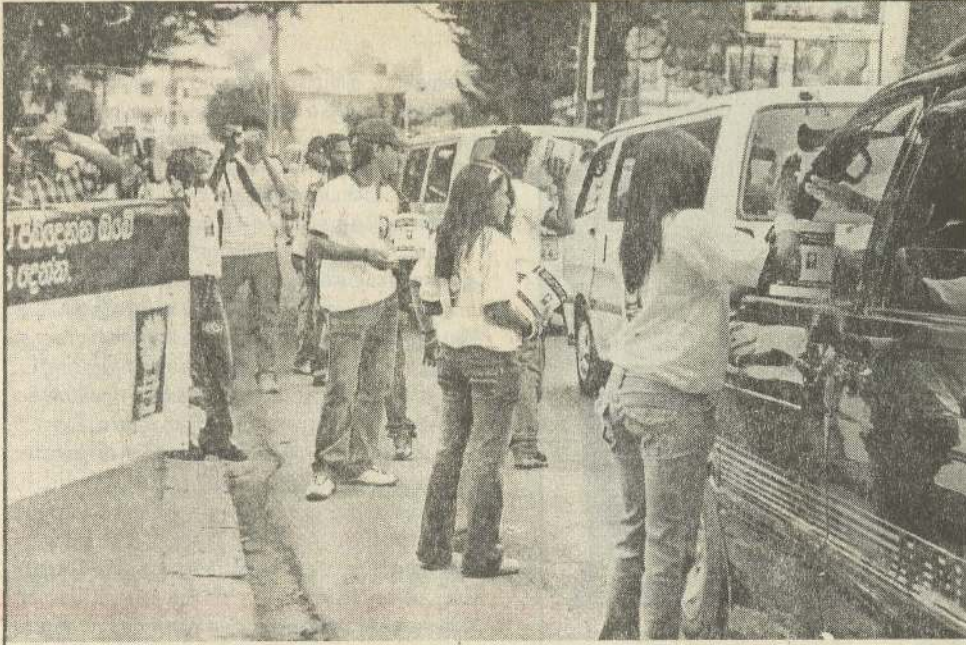
சிறுவர் துஷ்பிரயோக விழிப்புணர்வு நிகழ்ச்சியின்போது CIC Paints நிறுவனத்தின் ஊழியர்கள் நன்கொடை சேகரிக்கின்றனர்.

சிறுவர் துஷ்பிரயோகத்தை தடுத்து நிறுத்தவும் அது தொடர்பான விழிப்புணர்வை மக்கள் மத்தியில் ஏற்படுத்தவும் CIC Paints நிறுவனத்தின் சிறுவர் பாதுகாப்பு, நம்பிக்கை நிதியம் கடந்த மாதம் விழிப்புணர்வு நிகழ்ச்சி யொன்றை நடத்தியது. இந்நிகழ்ச்சி ஏப்ரல் மாதம் 14,15 மற்றும் 16ஆம் திகதிகளில் நுவரெலியா நகரில் நடத்தப்பட்டது. இந்நிகழ்ச்சியின்போது சிறுவர்களின் நலன்களை மேம்படுத்தும் பொருட்டு நிதி சேகரிக்கப்பட்டதோடு சிறுவர் துஷ்பிரயோகத்திற்கு எதிராக 3,000 பேரின் கையெழுத்துகளும் பெறப்பட்டன.