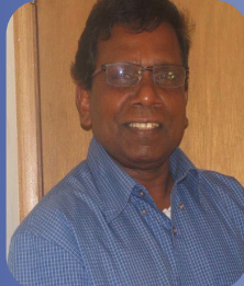
குரு சதாசிவம் பக்கம் 8