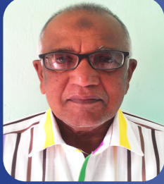
ஏ.என்.எம். நியாஸ் பக்கம் 4