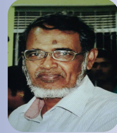
கூ.கலாவர்ணன் பக்கம் 36