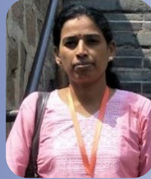
தாட்சாயினி பக்கம் 15