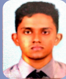
தர்சித் பக்கம் 36