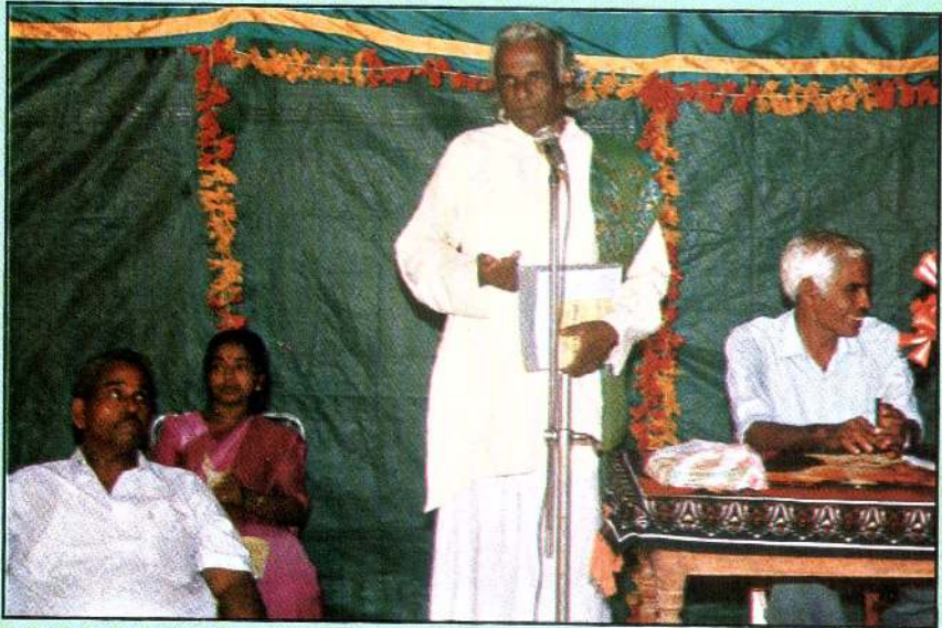
என் கடன் பணி செய்து கிடப்பதே - என்று திரு நிற்ற ஒரு விழா - ஒரு வார கிராம விழா நிகழ்வு (நாள் 22. 04. 2000)