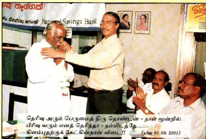
தெரிவு அரும் பெருமைத் திரு தொண்டன் - நாள் மூன்றில் பிரிவு வரும் எனத் தெரிந்தா - நம்மிடத்தே கிளம்புதற்குக் கேட்கின்றான் விடை!! (நாள் 30. 09. 2001)