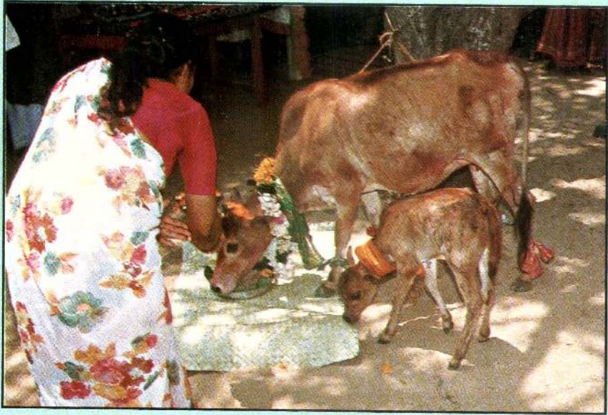
ஆன்றிரைகள் அறுகு அருந்தி அசைபோடும் நிலை போச்சே - என தான் உருகி ஒரு திட்டம் தருகின்றான் தொண்டன்! (கோமாதா பூசை)