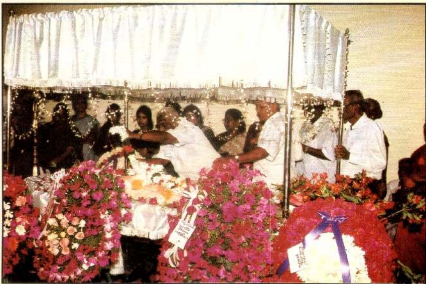
பூக்கள் மொய்க்கும் புண்ணியன் 'திரு'