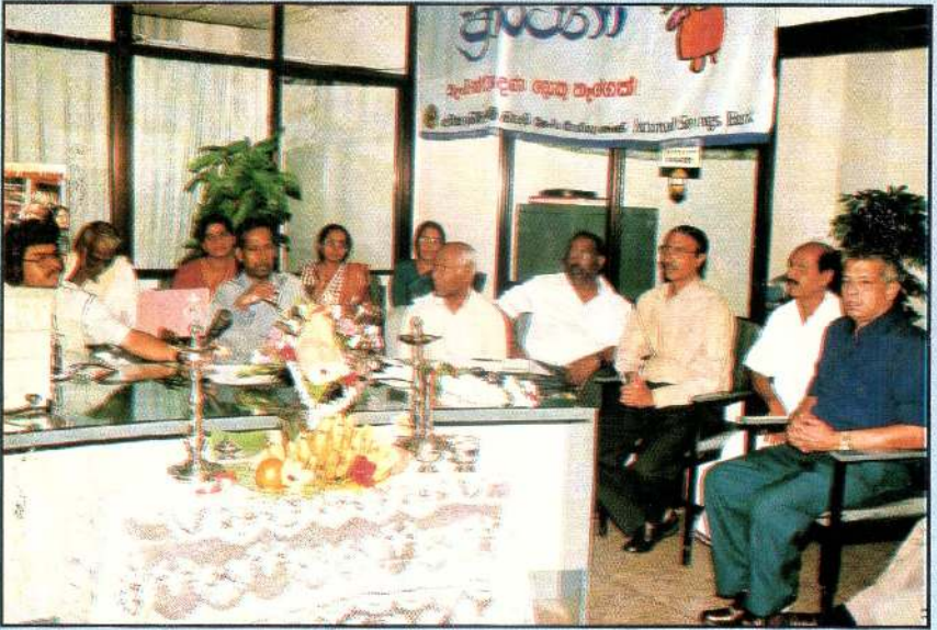
செயற்றிட்டங்களை ஆலோசிக்க ஆரம்பித்துவிட்ட கழகத்தின் தலைமை நிர்வாகிகள்