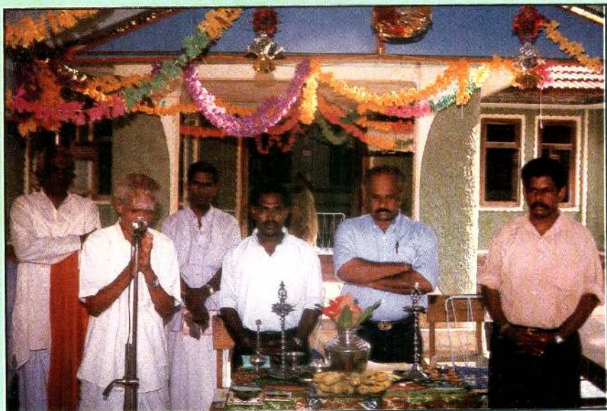
தொடங்கியது தொடர வேண்டும் என்ற தொண்டனின் தூண்டுதல் - பெருங்காடு தெற்கு கிராம அபிவிருத்திச் சங்கத்தின் 3வது ஆண்டு விழா (நாள் 11.04. 2000)