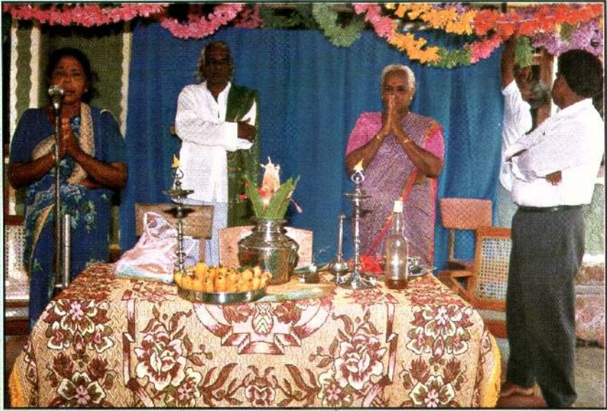
‘மாதர் தமை ஏத்துவோம்’ என்று மனிதத்தை விதைக்கின்றான் பெருங்காடு தெற்கு மாதர் அபிவிருத்திச் சங்கம் ஆரம்பமாகின்றது (நாள் 20.04. 2000)