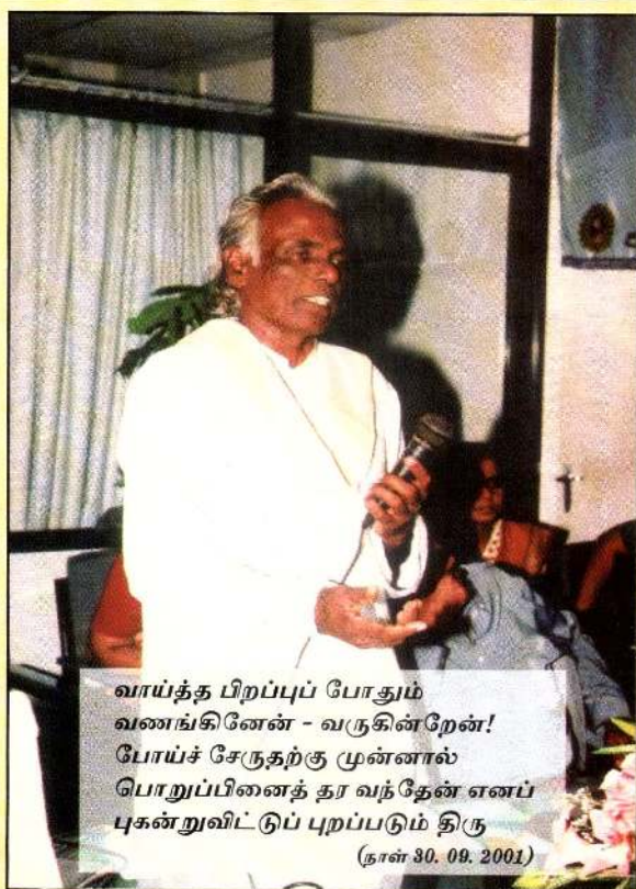
வாய்த்த பிறப்புப் போதும் வணங்கினேன் - வருகின்றேன்! போய்ச் சேருதற்கு முன்னால் பொறுப்பினைத் தர வந்தேன் எனப் புகன்றுவிட்டுப் புறப்படும் திரு (நாள் 30. 09. 2001)