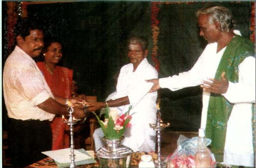
பெரியோரைப் பேணல் - சொல்லைச் செயலாக்குஞ் சுறுசுறுப்பில் - முதியோர் கௌரவிப்பு விருந்துபசாரத்தில் (நாள் 19.04. 2000)