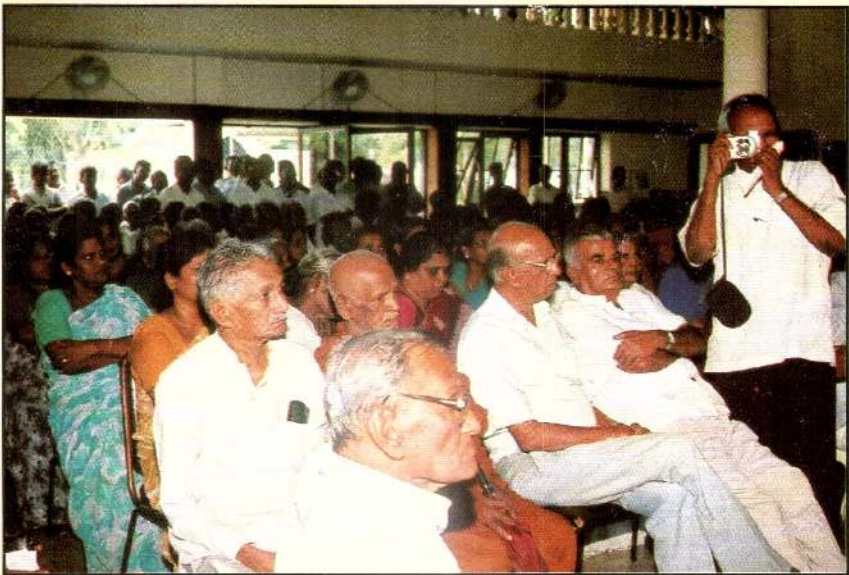
ஜெயரத்ன மலர்சாலையில் 'திரு'வை அஞ்சலிக்கும் அன்பர் கூட்டம்