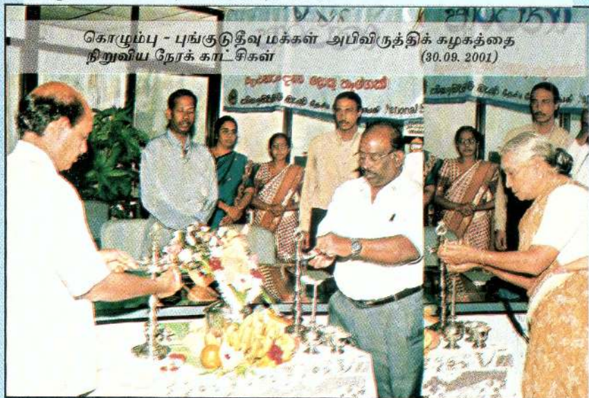
கொழும்பு - புங்குடுதிவு மக்கள் அபிவிருத்திக் கழகத்தை நிறுவிய நேரக் காட்சிகள் (30.09.2001)