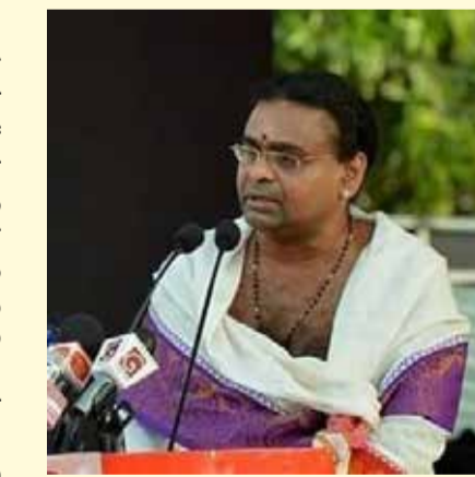
வர்கள் இயன்றவரை உதவி, அனைவருக்காகவும் பிரார்த்திப்போம். - என்று உள்ளது.

இச்சமயத்தில் நாம் இயன்றவரை அதிகரித்த செலவினை தவிர்த்து, தேவையுடைய மக்களுக்கு இயன்றவரை உதவியுடன் ஆதரவு வழங்குவது நமது கடமையாகவும் தேவையாகவும் உள்ளது. ஆகவே இயன்ற