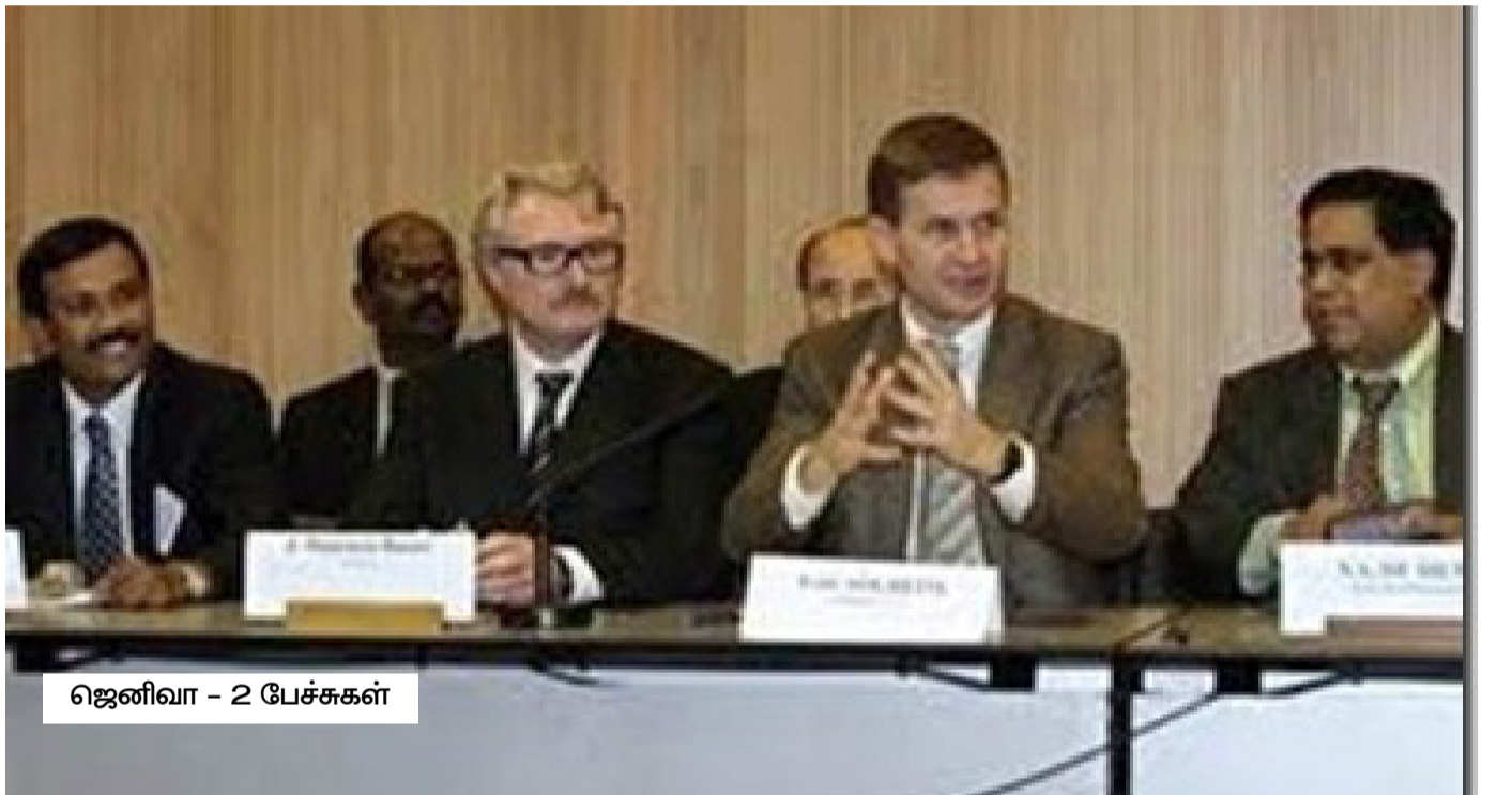
ஜெனிவா - 2 பேச்சுகள்

கம் மறைந்த பின், விடுதலைப் புலிகளுடனான தொடர்புகள் மேலும் பாதிப்படைந்தன. விடுதலைப் புலிகளின் உயர்மட்டத்தில் கருத்து பரிமாற்றங்களுக்கு நம்பிக்கையான இடைத் தூதுவர்கள் இல்லாதமையால் மிகுந்த சிரமங்கள் ஏற்பட்டன.