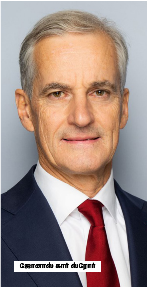
ஜோனாஸ் கார் ஸ்ரோர்