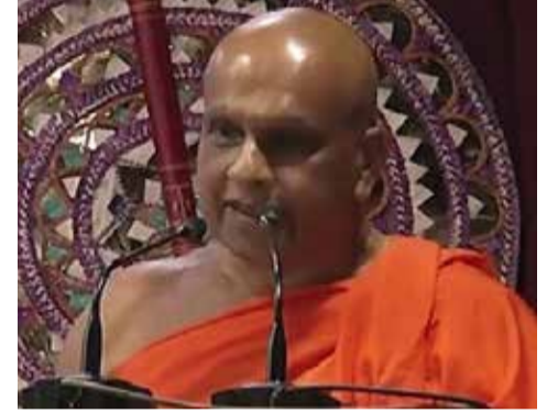
இரட்டைக் குடியரிமை வைத்திருப்பவர்கள் இலங்கைப் பிரஜைகளுக்கு பாதிப்பை ஏற்படுத்தும் தீர்மானங்களை எடுக்க அனுமதிப்பது பிரச்சினைக்குரியது என்றும் அவர் சுட்டிக்காட்டியுள்ளார்.

நாட்டின் பொருளாதாரம், அரசியல் செயற்பாடுகளில் செல்வாக்கு செலுத்தக் கூடிய உயர் பதவிகளை இரட்டை பிரஜைகள் வகிக்க இடமளிக்கக் கூடாது எனவும் கூறியுள்ளார்.