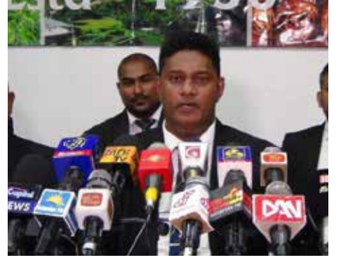
குறிப்பாக பெருந்தோட்டத்துறையின் அழிவின் ஆரம்பமாகக்கூட இதனைப் பார்க்கலாம். பெருந்தோட்டத்துறையின் இருப்பைக் காக்க முடியாது என்பதே எமது மற்றும் தொழிலாளர்களின் கருத்தாகும். என்றார்.

தொழிலாளர்களுக்கு காணிகளை பங்கீட்டுவழங்கினால் அவர்கள் தேயிலை பயிரிடமாட்டார்கள். கிழங்கு, கரட் உள்ளிட்ட விவசாய உற்பத்திகளையே மேற்கொள்வார்கள். இதனால் தேயிலை ஏற்றுமதி பாதிக்கப்படும்.