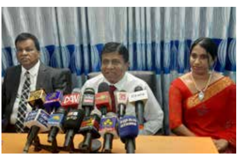
போன்ற விடயங்கள் தொடர்பில் ஆராய வேண்டியுள்ளது.

அவர்களுக்கு எவ்வாறு போதைப்பொருள் கிடைக்கின்றது, எங்கிருந்து வடபகுதிக்கு போதைப்பொருள் கொண்டுவரப்படுகின்றது