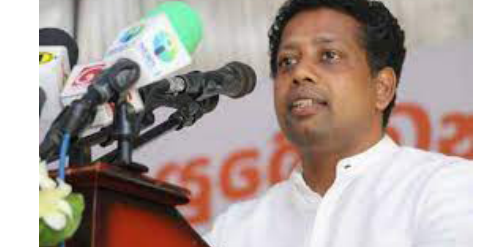
லாளர்களாகப் பராமரிக்கவே இதற்கான ஏற்பாடுகள் இடம்பெற்றன.

தமிழ் முற்போக்கு கூட்டணியின்தாயகம் திறந்து வைக்கப்பட்டுள்ளது. இதுவெறும் கட்டட திறப்பு விழா அல்ல. மலையக சமூகத்தினுடைய அடையாளத்தைப் பிரதிபலிக்கும் நிகழ்வாகும். அதாவது ஒரு தேசிய இனத்துக்குரிய அம்சத்தை வெளிப்படுத்தியுள்ளோம். கடந்த 200 ஆண்டுகளில் மலையகத்தில் பல திறப்பு விழாக்கள் நடந்தன. பெருந்தோட்ட மக்களை கூலித்தொழி