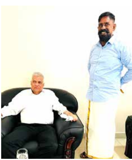
பாட்டில் இறங்கினார் இதன் பொருட்டு இதற்கான சகல ஏற்பாடுகளும் ஏற்பாடாகி வருகிறது. இது விடயமாக மத்திய வங்க ஆளுனருக்கு அவச பணிப்புரை ஒன்றை ஜனாதிபதி வழங்கியுள்ளார்.