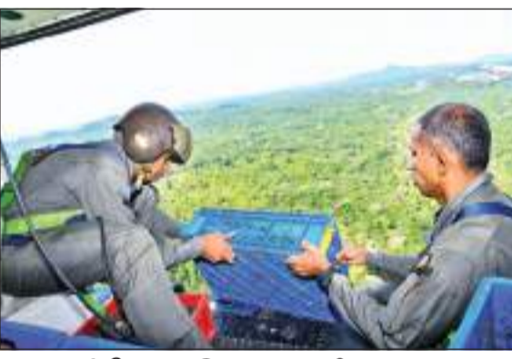
வீரவெல இலங்கை விமானப்படை தளத்தை மையமாக கொண்டு இல 04 ஹெலிகொப்டர் படைப்பிரிவிற்கு உரித்தான பெல் 212 ரக ஹெலிகொப்டர் மூலம் 20 தடவைகள் இந்த விதைகளை டெலிவரி செய்து கொள்ளப்பட்டது. இதன்போது 80 ஏக்கர் பரப்பளவு கொண்ட வனப்பகுதியில் கூலன், வேம்பு, ஆத்தி, நாகை, புளி, பருத்தி, பாலை, வீரை, மருது, கித்துள் உட்பட 100,000 விதைகள் தாயரிக்கப்பட்டு வான் வழிமூலம் தெளிக்கப்பட்டன.