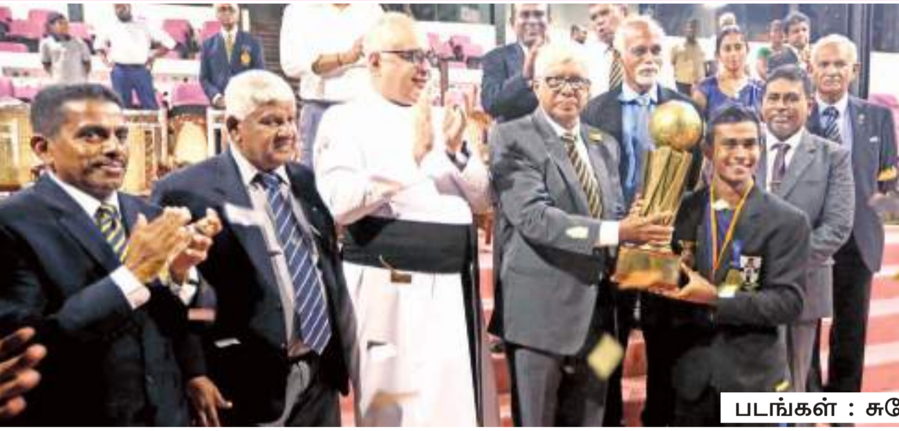
படங்கள் : சுலோச்சன கமகே