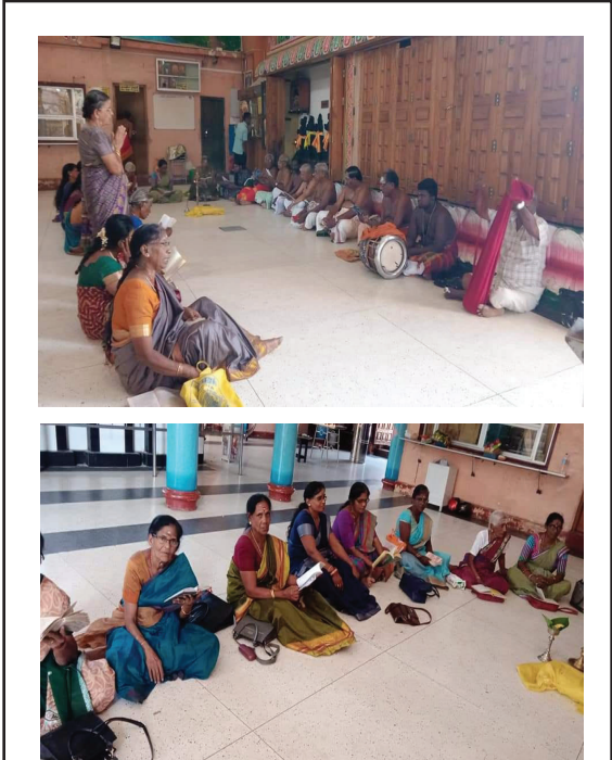
திருக்கோணேஸ்வரத்தில் மாதம் ஒரு வெள்ளிக்கிழமை திருவாசகம் முற்றோதல் நடைபெற்று வருகிறது. அந்த வகையில் திருக்கோணேஸ்வர ஆலயத்தில் இன்றைய தினமும் திருவாசகமுற்றோதலில் அருளாளர்கள் ஈடுபட்டனர். அதன்படங்களைக்காணலாம் (வாஸ்ஆனந்தம்)

நாள்தோறும் சுபீட்சம் நிகழ்நிலை பத்திரிகையை பார்வையிட www.supeedsam.com