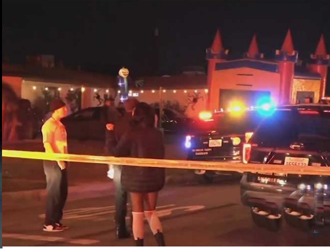
லொஸ்ஏஞ்சல்ஸ், நவ.01 அமெரிக்காவின் முக்கிய மாகாணம் ஒன்றில்