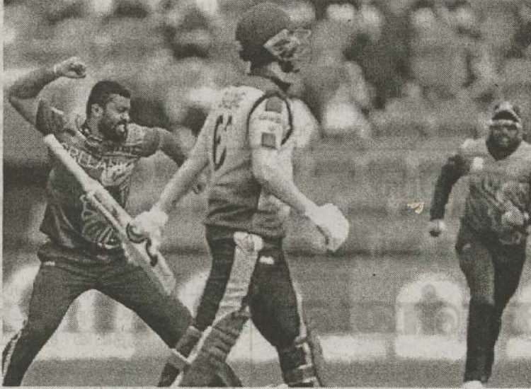
உலகக் கிண்ண இரு நேற்று ஞாயிற்றுக்கிழமை புது-20 போட்டித் தொடரின் இடம்பெற்ற போட்டியில்

இலங்கை அணி அயர்லாந்து அணியை 9 விக்ெட்டுக்கள் வித்தியாசத்தில் வீழ்த்தி அபார வெற்றி பெற்றுள்ளது.