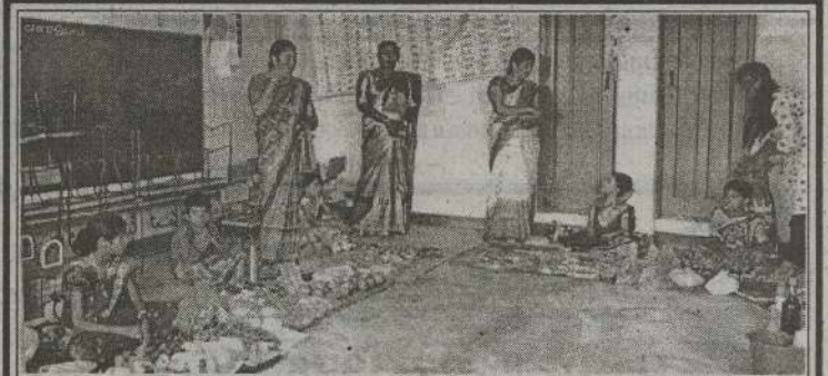
யா/மருதங்கேணி இந்து தமிழ்க் கலவன் பாடசாலை ஆரம்பப் பிரிவு மாணவர்களின் மாதிரி சந்தை நிகழ்வு பாடசாலை பிரதான மண்டபத்தில் கடந்த 13 ஆம் திகதி நடைபெற்றது.

பரங்களை எதிர்வரும் 12.11.2022 இற்கு முன்னர் கிடைக்கக்கூடியவாறு நிலையப் பொறுப்பதிகாரி, கலாசார மத்திய நிலையம், பிரதேச செயலக அருகாமையிலும், மருதங்கேணி எனும் முகவரிக்கு நேரடியாகவோ அல்லது தூய்மூலமாகவோ அனுப்புமாறு நிலையப் பொறுப்பதிகாரி த.அமல்ராஜ் அறிவித்துள்ளார். மேலும் தொடர்புகளுக்கு மருதங்கேணிபிரதேச செயலர் பிரிவிற்குட்பட்ட வளவாளர்களுள் (ஆசிரியர்கள்) தங்களது சமய