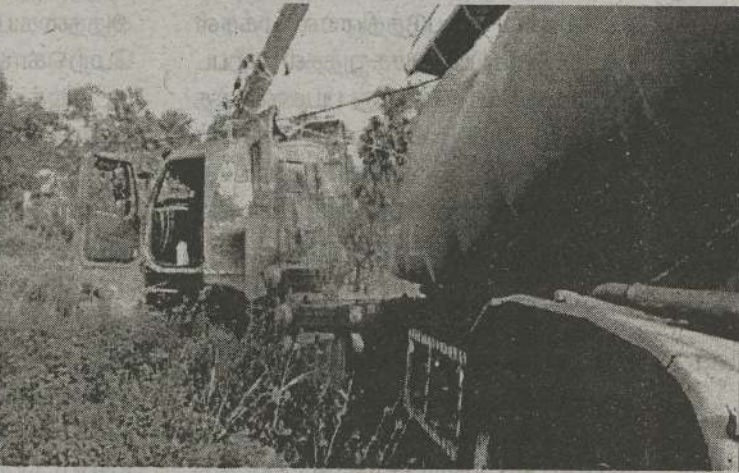
(திருமலை) திருகோணமலை - அநுராதபுரம்

பிரதான வீதியில் துவரங்காடு சந்தியில் ஏற்பட்ட வாகன விபத்தில் இருவர் பலத்த காயங்களுடன் திருகோணமலை பொது மருத்துவமனையில் அனுமதிக்கப்பட்டுள்ளனர். குறித்த விபத்தின் காரணமாக மின்கம்பம் மற்றும் மின்கம்பிகள் சேதமடைந்ததால் திருகோணமலையின் பரவலான பகுதிகளுக்கு மின்சாரம் துண்டிக்கப்பட்டது. விபத்து தொடர்பிலான மேலதிக விசாரணைகளை திருகோணமலை உப்பு வெளி பொலிஸார் மேற்கொண்டு வருகின்றனர். (நி)