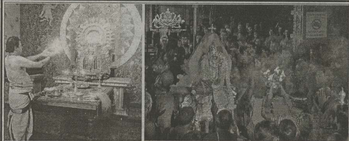
யாழ்ப்பாணம்-நல்லூர் கந்தசுவாமி கோயில், மாவிட்டபுரம் கந்தசுவாமி கோயில் ஆகியவற்றில் கந்தசஷ்டி 1 ஆம் நாள் உற்சவம் நேற்று காலை பக்திபூர்வமாக இடம்பெற்றது.

முன்னிட்டு வலி.வடக்கு பிரதேச சபை தெல்லிப்பழை உப அலுவலகம் மற்றும் தெல்லிப்பழை பொது நூலகத்தின் ஏற்பாட்டில் தெல்லிப்பழை துர்க்கையம்மன் ஆலய முன்றலில் காலை 9 மணியளவில் ஆரம்பித்த