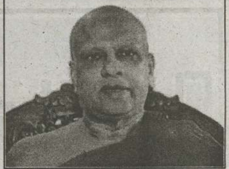
மையான எதிர்ப்பை வெளிப்படுத்துவோம் என தேரர் தெரிவித்தார். (நி)

(கொழும்பு) குருந்தூர் மலை இந்துக் கோவில் என குறிப்பிடுவதை ஏற்றுக்கொள்ள முடியாது. குருந்தூர் மலை பௌத்த விகாரை என்பதை அனைவரும் ஏற்றுக்கொள்ள வேண்டும்.