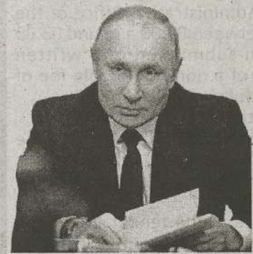
(மொஸ்கோ) ரஷ்யாவின் அணு ஆயுதத்